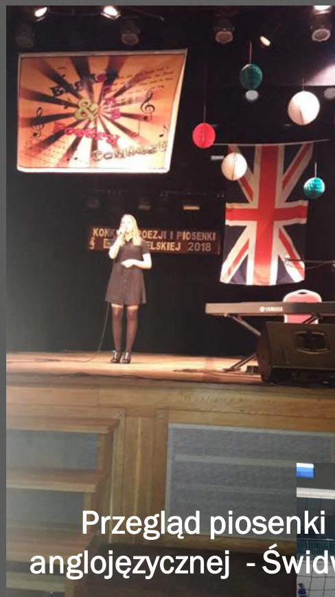
Przeгляд piosenki anglojęzycznej - Świdwin