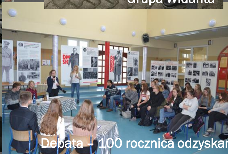
Debata – 100 rocznica odzyskania niepodległości