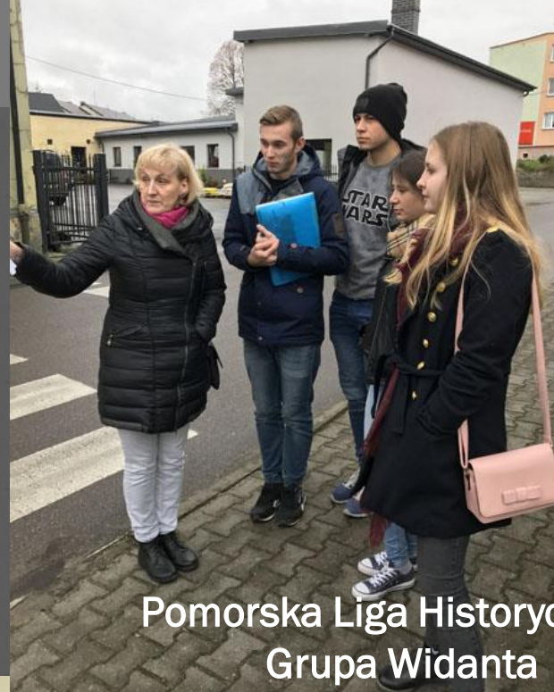
Pomorska Liga Historyczna – Grupa Widanta