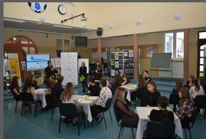
Warsztaty – Demokracja w praktyce