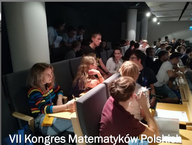
VII Kongres Matematyków Polskich – UMSC w Lublinie