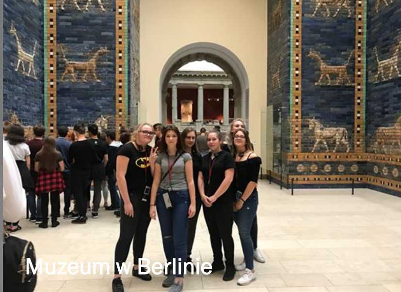
Muzeum w Berlinie