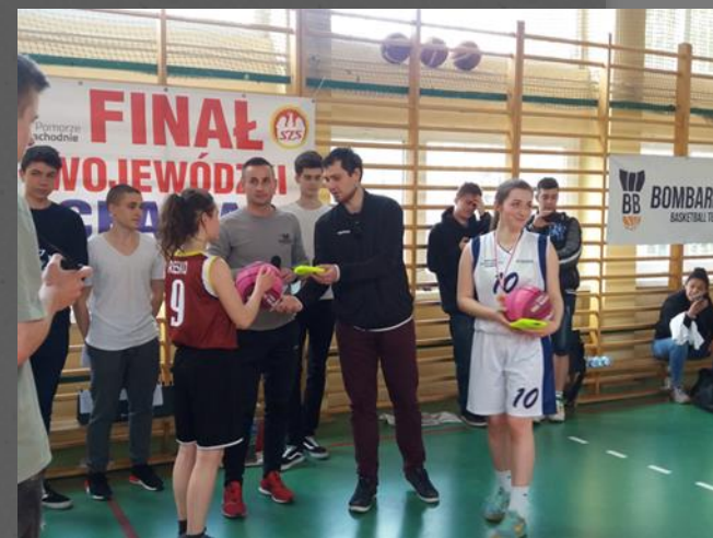
Finały wojewódzkie Licealiady – piłka koszykowa i siatkowa