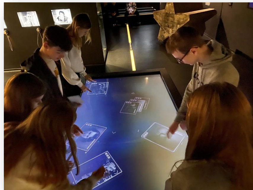
CENTRUM DIALOGU PRZEŁOMU