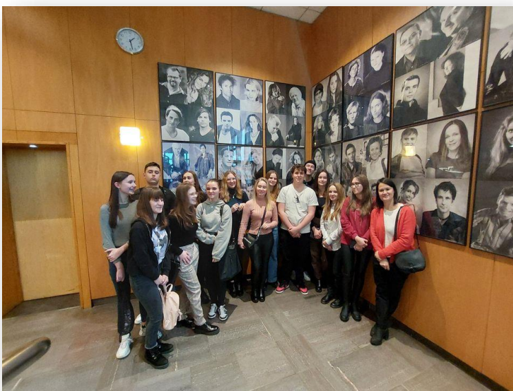
TEATR W SCHWEDT