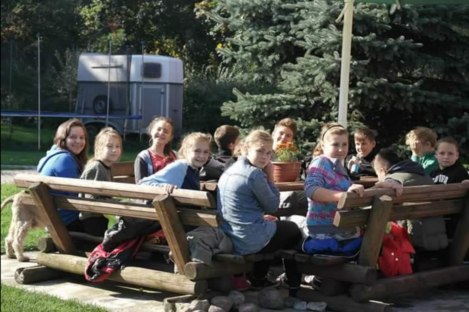
Program „Podróże Paddingtona”