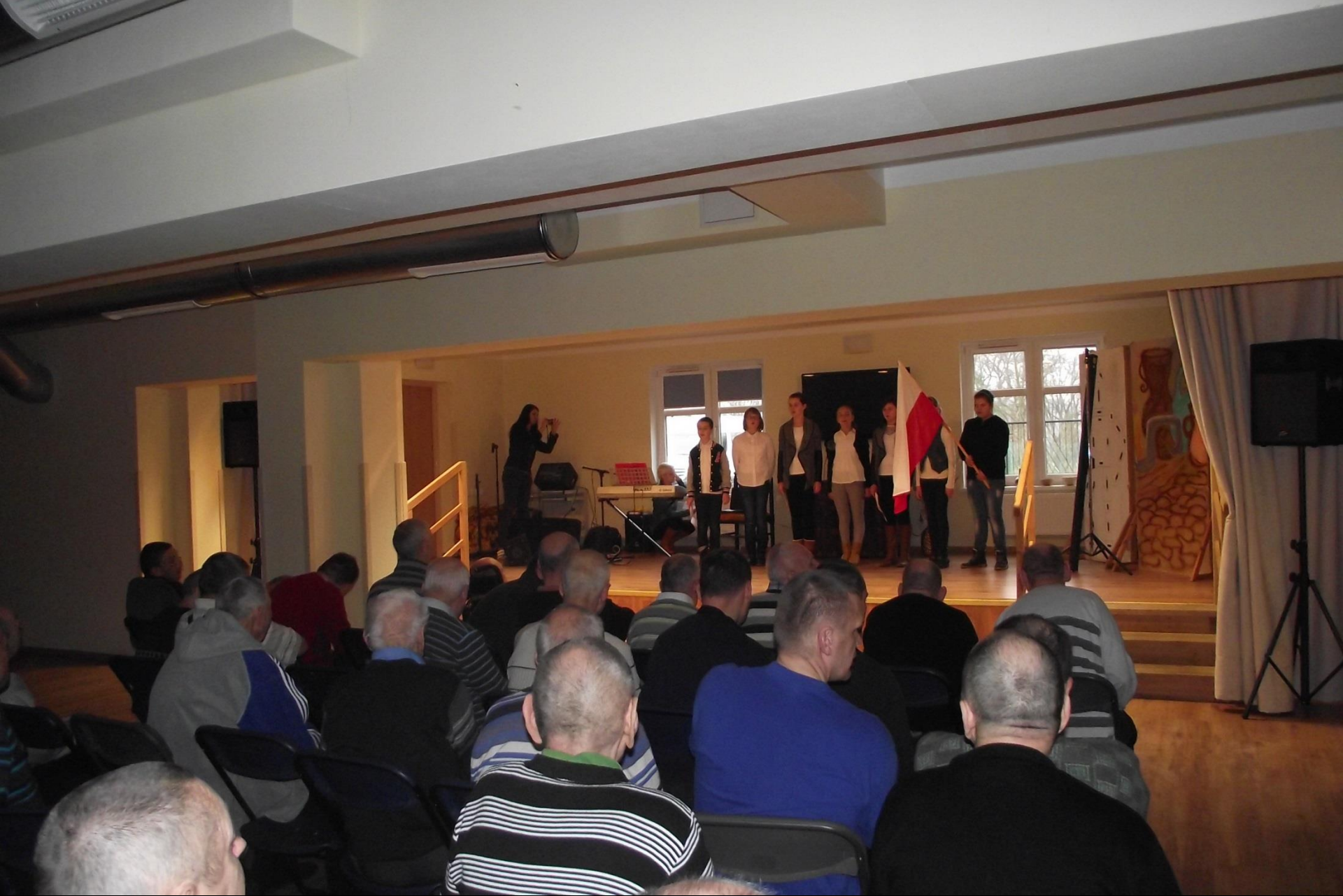
Przedstawienie w DPS-ie