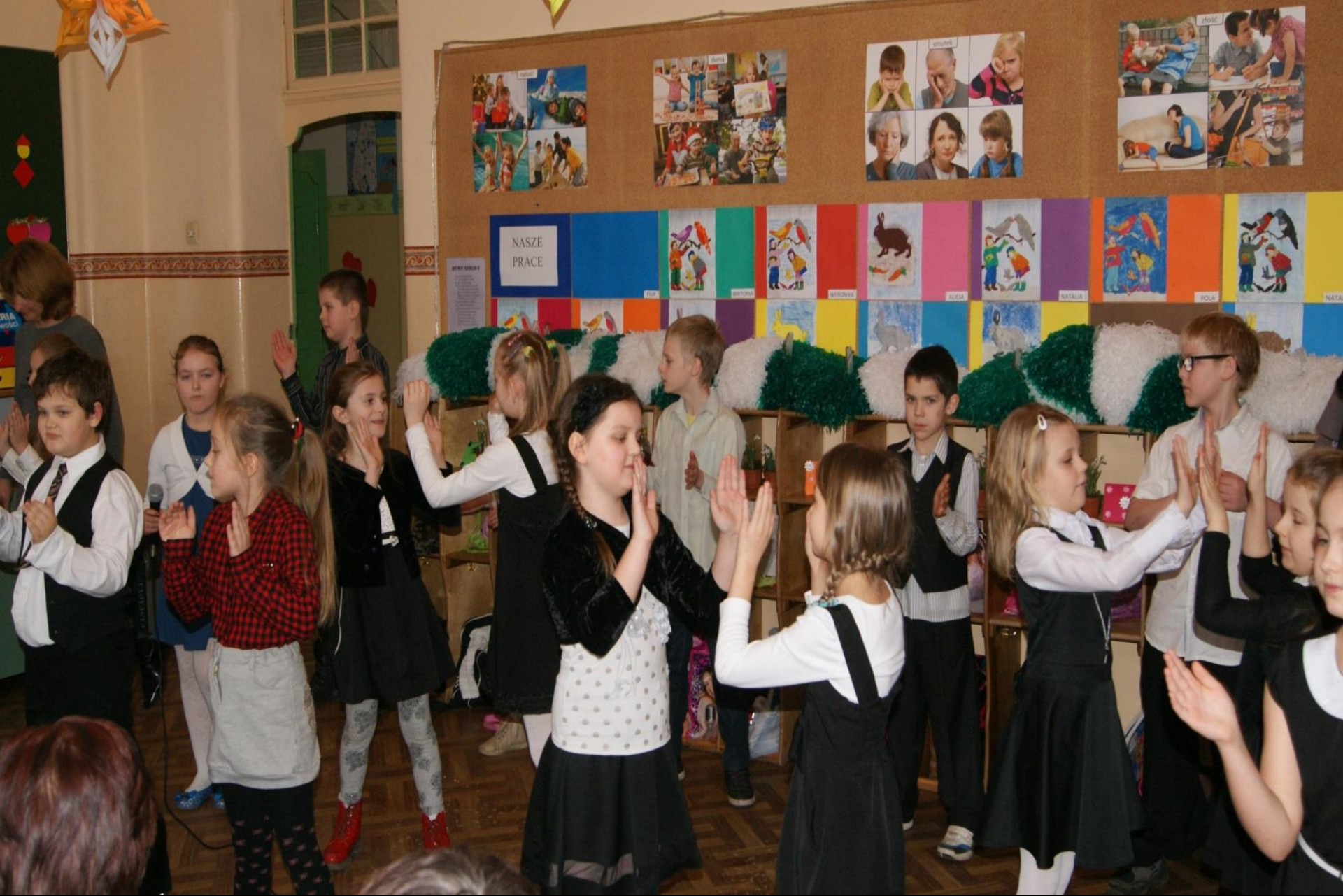
Dzień Babci i Dziadka