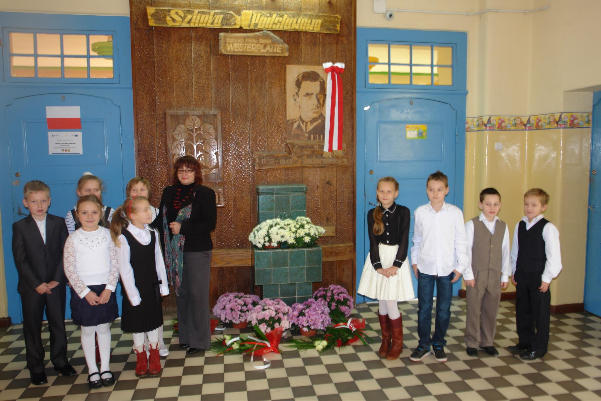
Dzień Patrona – złożenie kwiatów pod tablicą pamiątkową