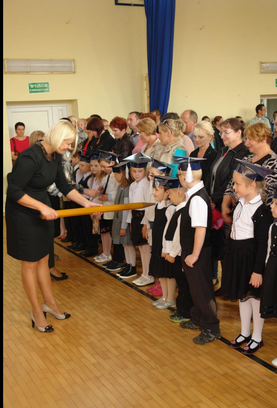
Pasowanie na ucznia