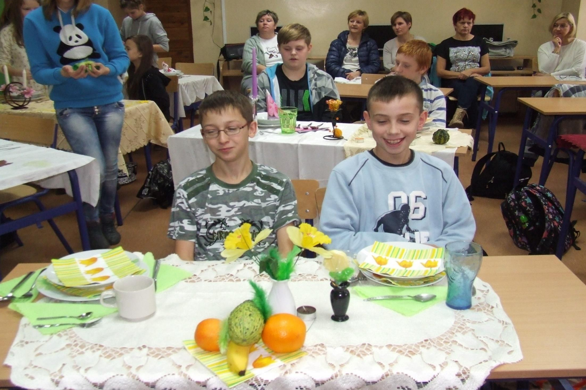
Lekcja otwarta „Nakrywamy do stołu”