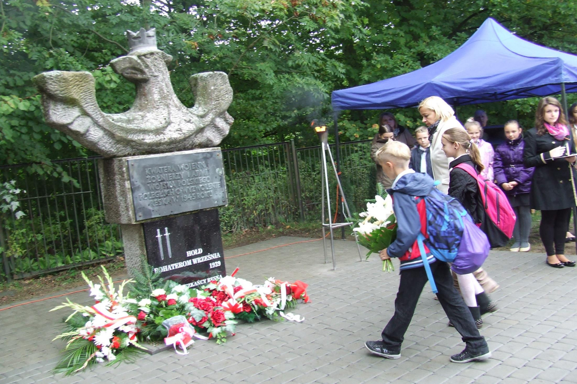
Rocznica powstania Państwa Podziemnego