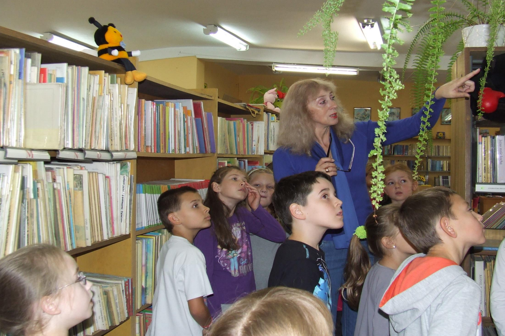
W Bibliotece Miejskiej – kl. II a