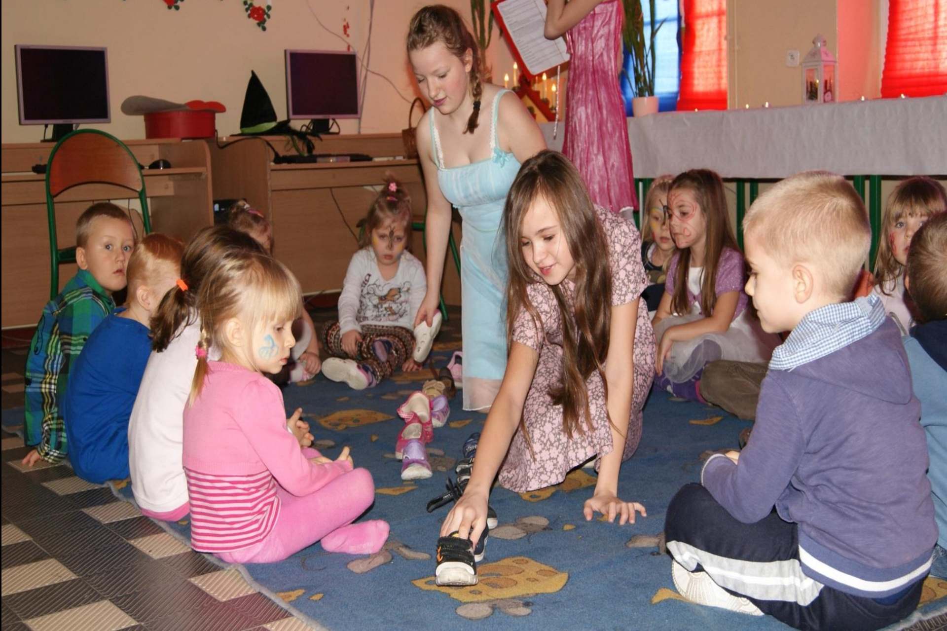
Andrzejki z udziałem przedszkolaków