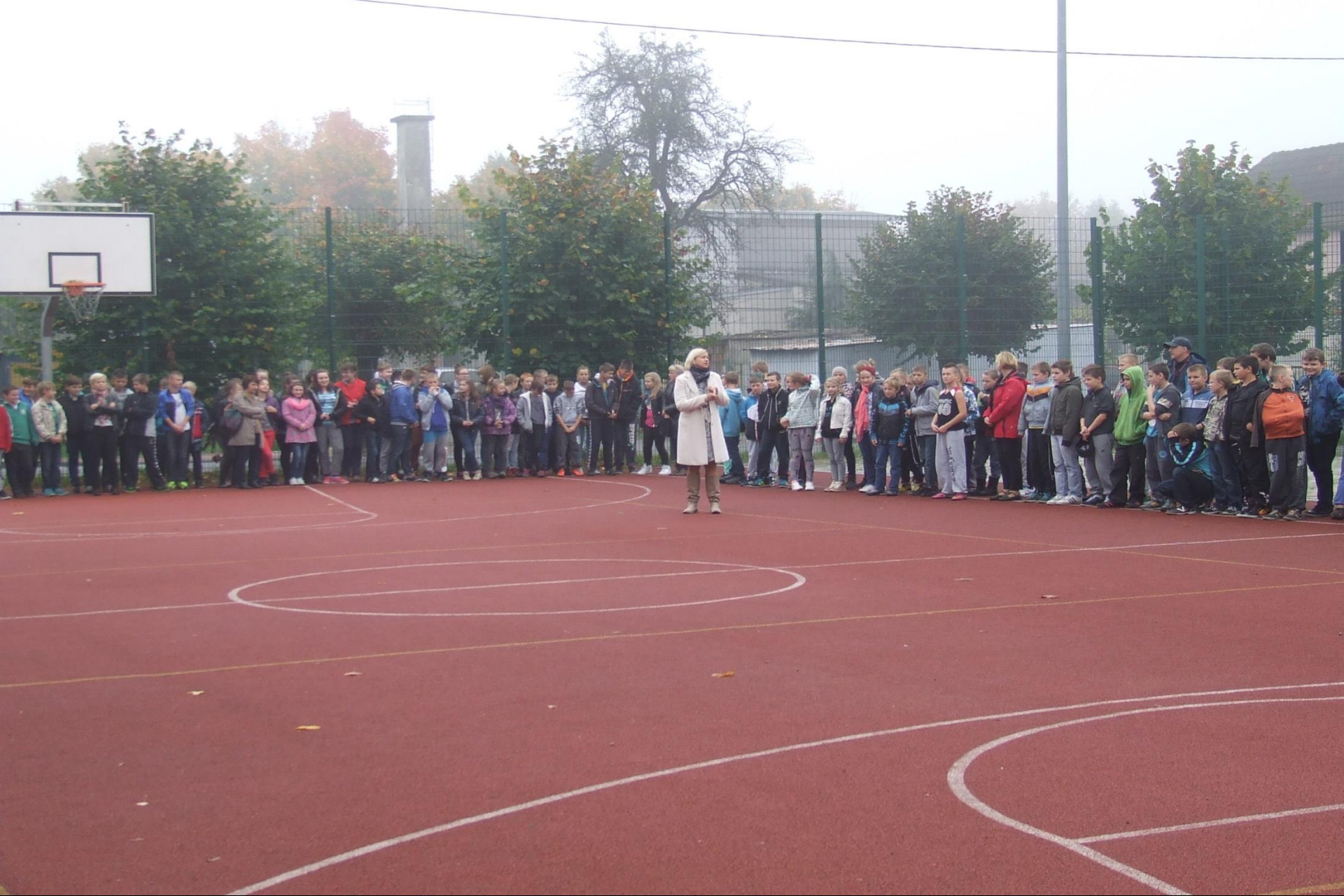
Próbna ewakuacja szkoły