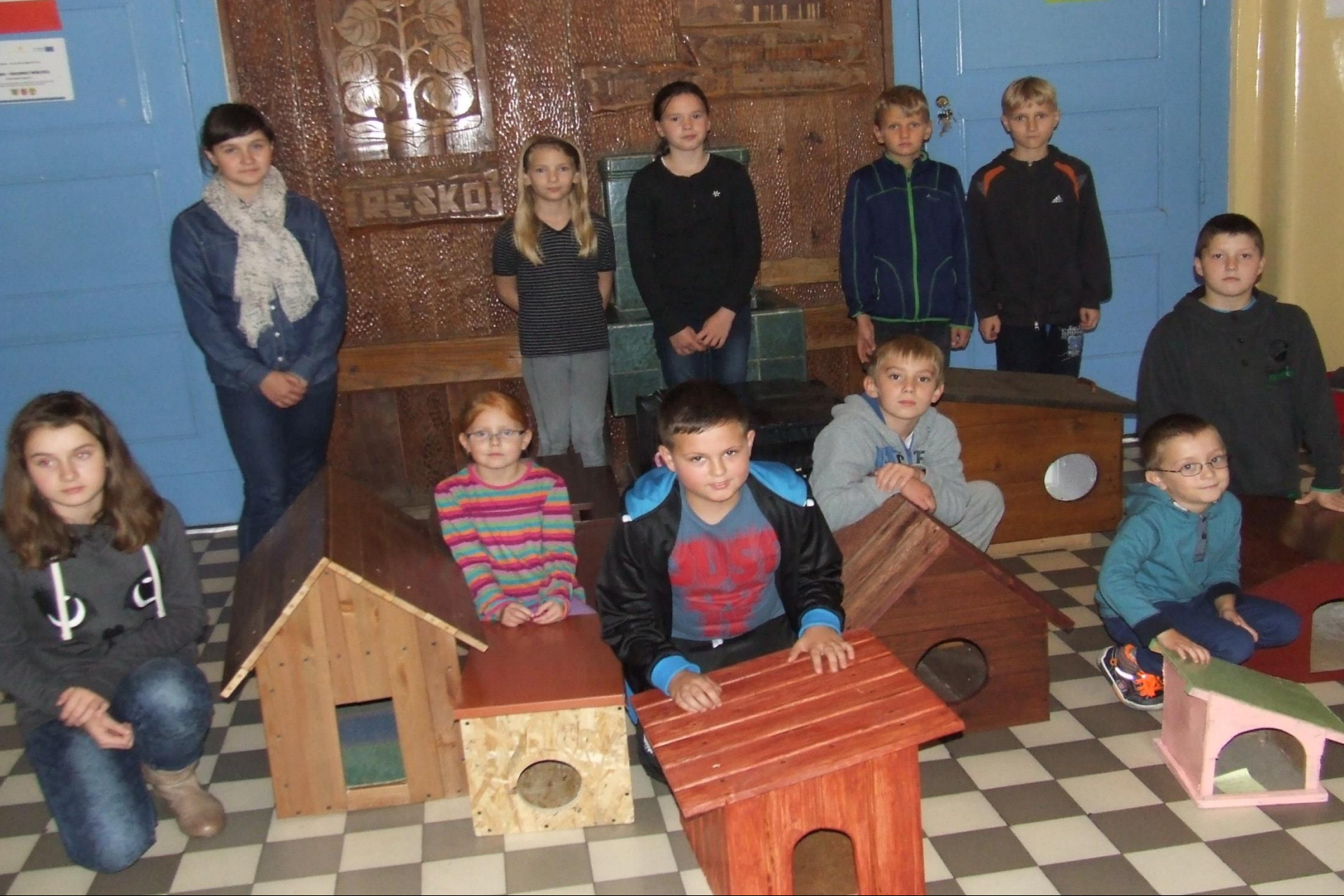
Budki dla bezdomnych kotów