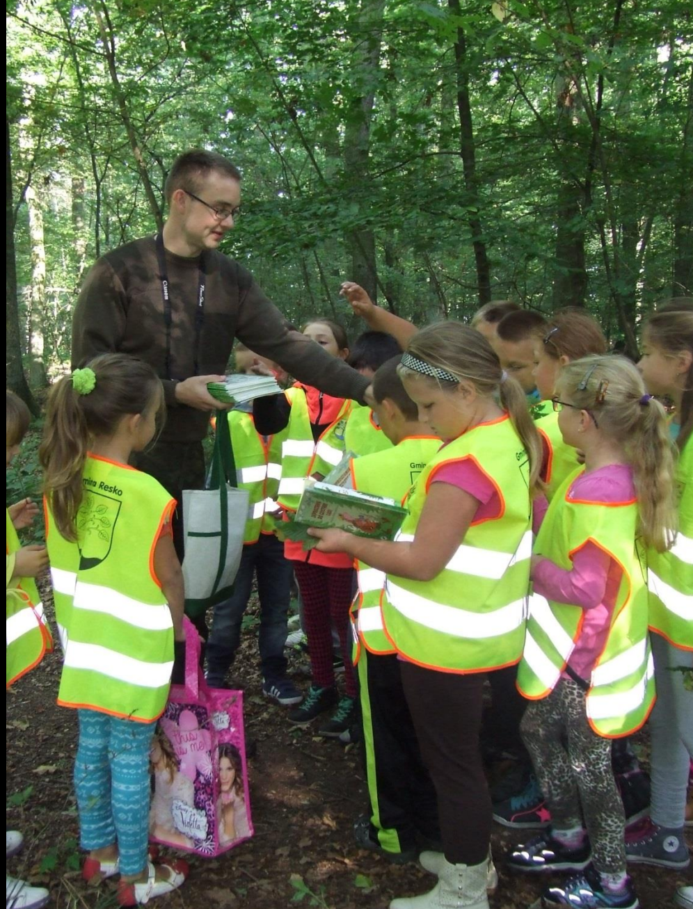
Współpraca z Nadleśnictwem