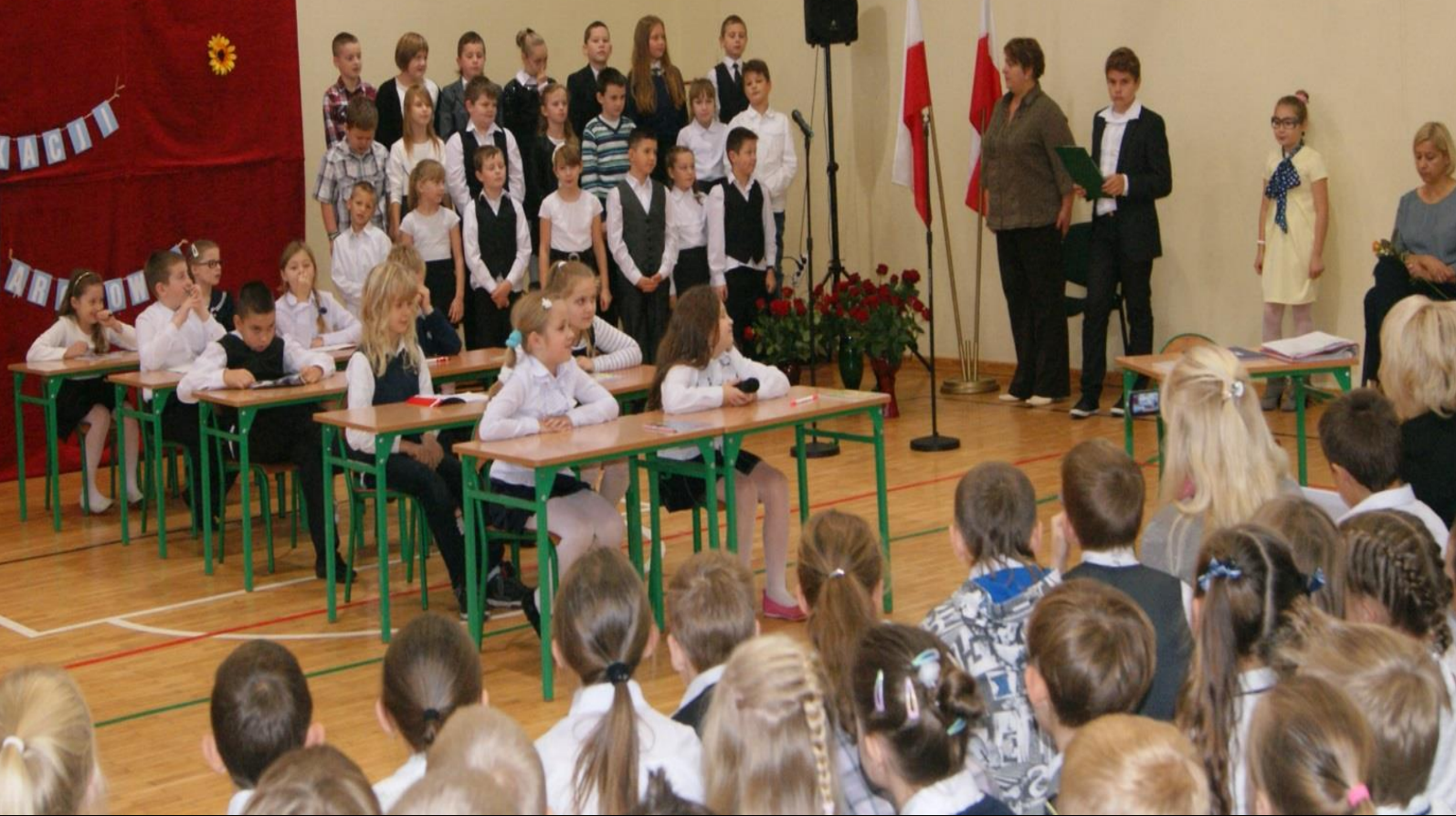
Dzień Edukacji Narodowej