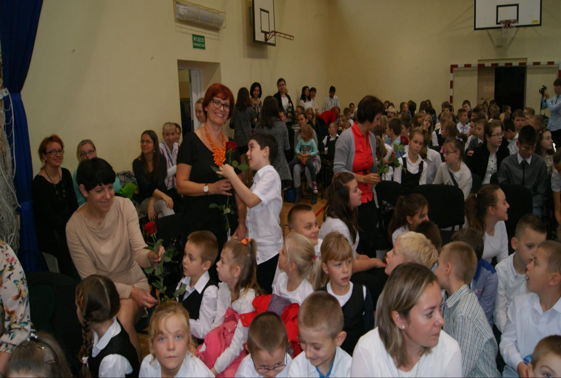
Dzień Edukacji Narodowej