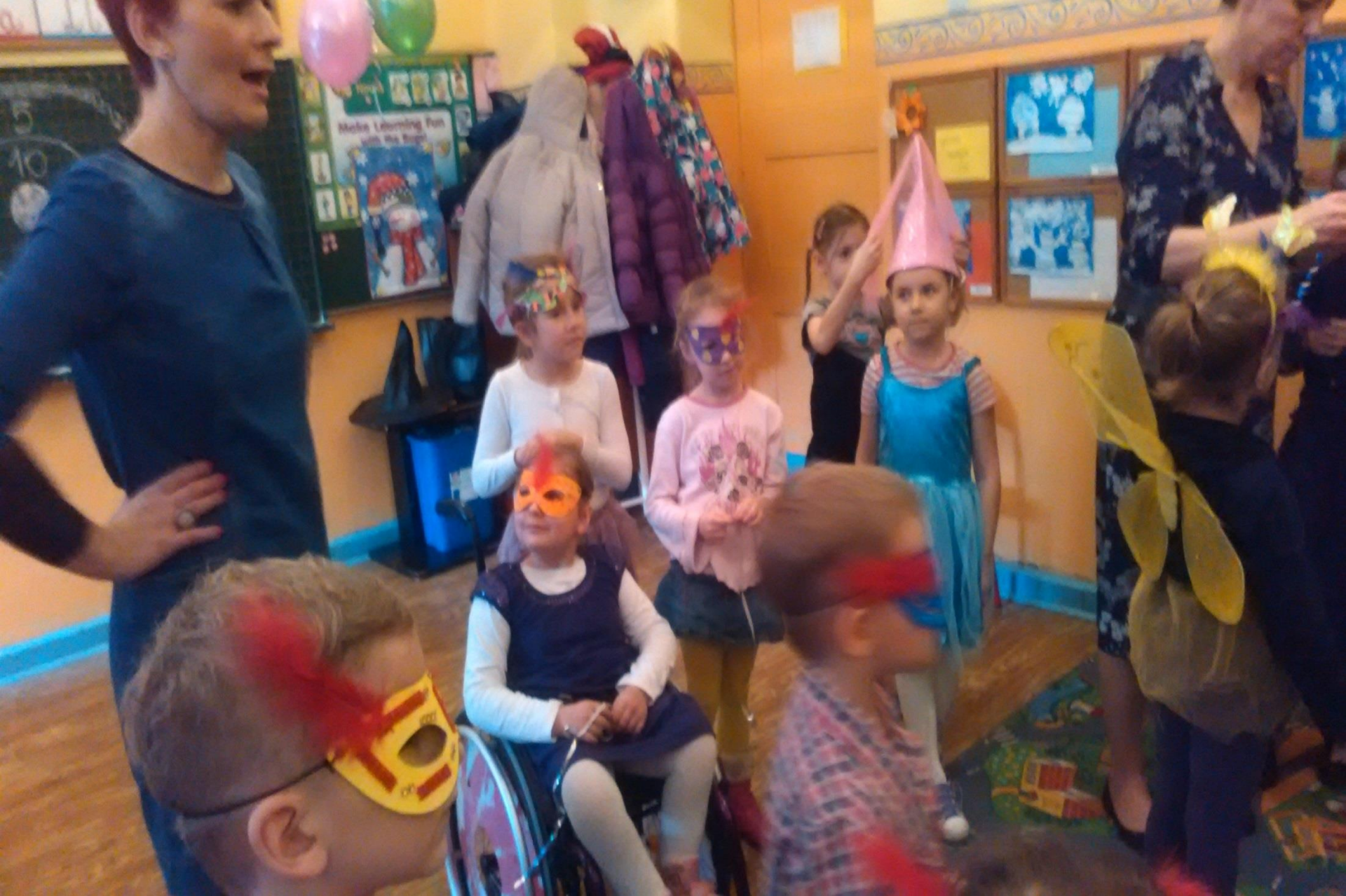
Współpraca z Przedszkolem Miejskim – wizyta sześciolatków