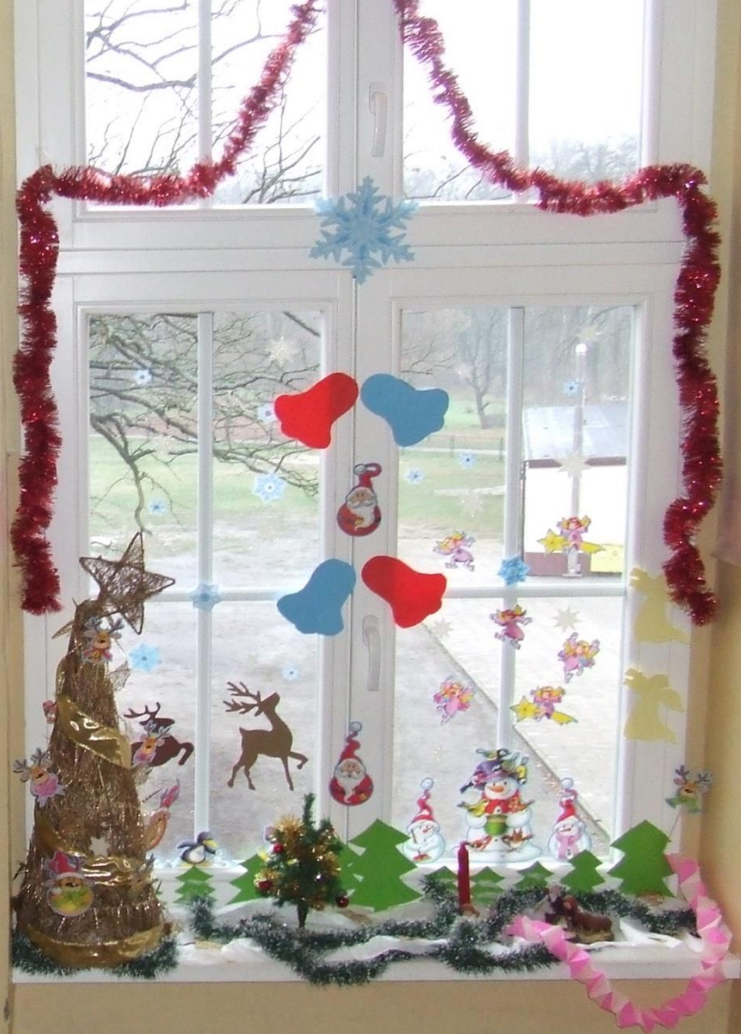
Konkurs „Zimowe okno”