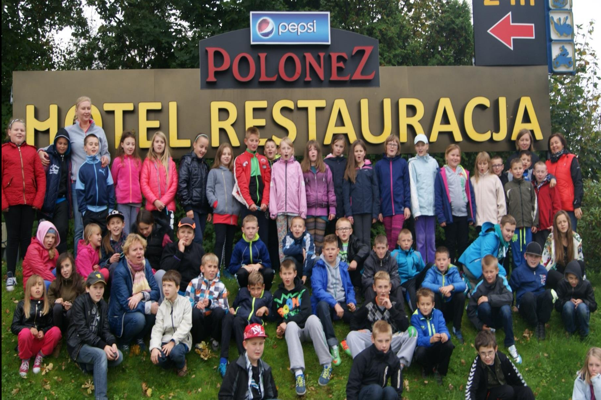
Wyjazd integracyjny klas IV do Rymania