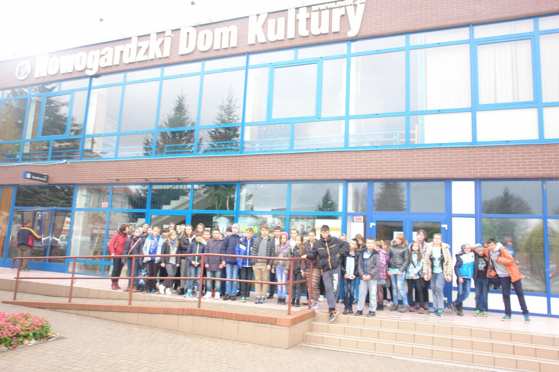
Klasy VI na przedstawieniu „Ten Obcy”