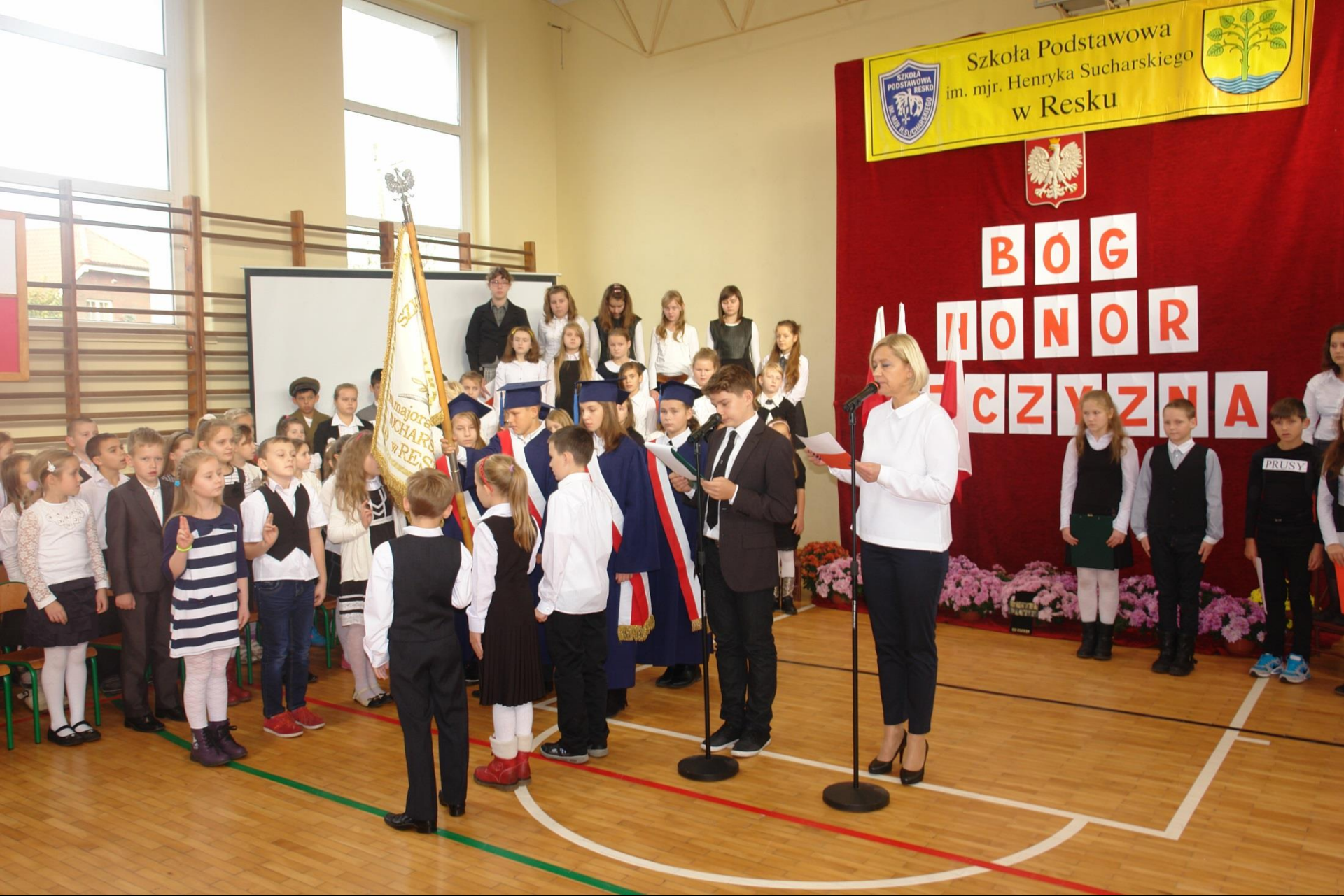
Dzień Patrona – ślubowanie kl. III na sztandar szkoły