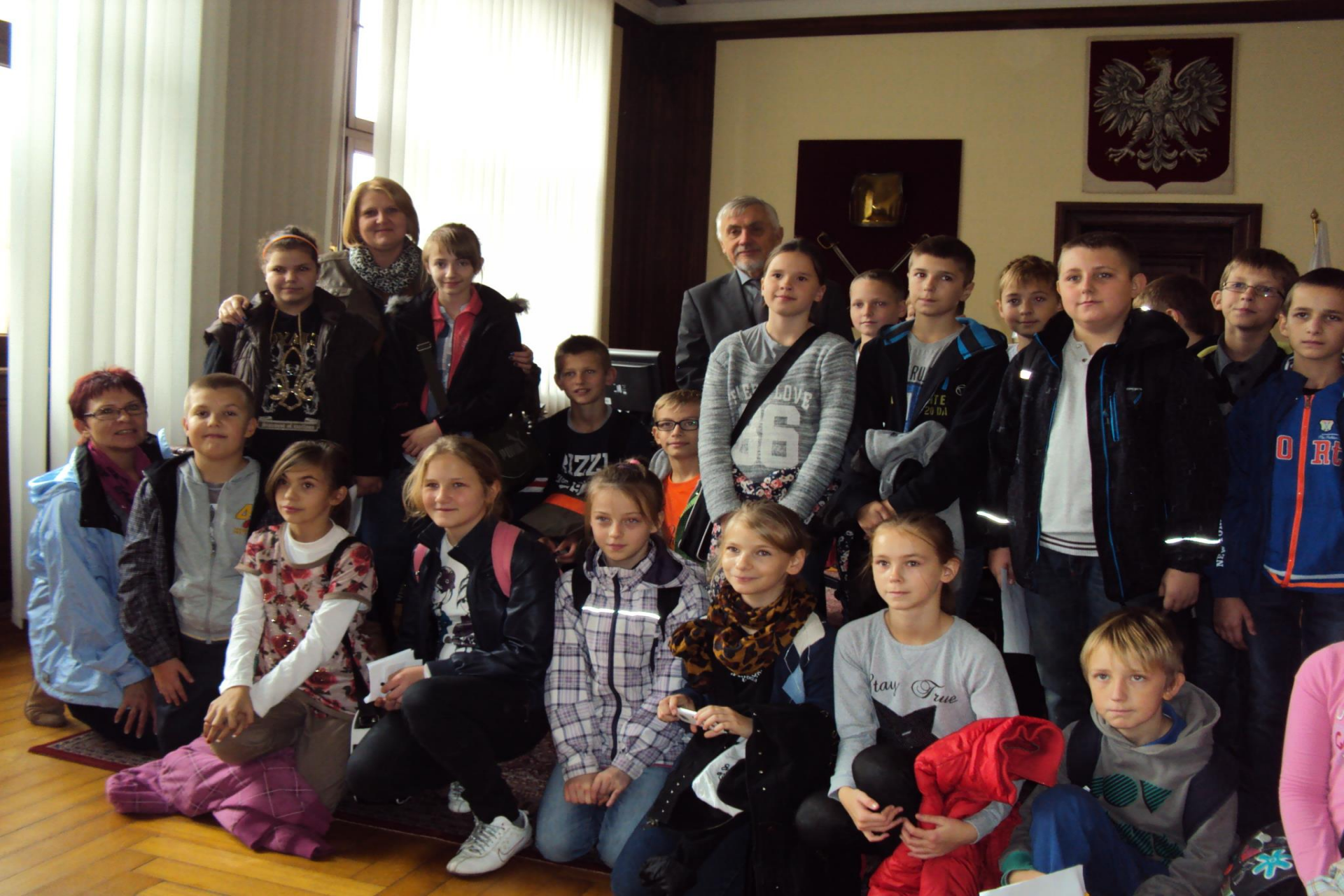
Wizyta kl. V w Urzędzie Miejskim w Szczecinie