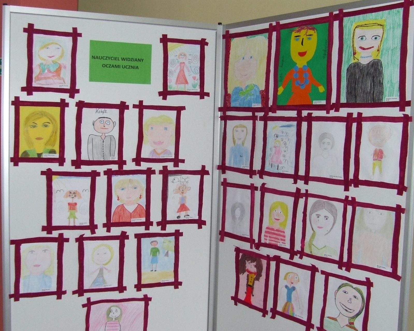
Wystawa w CK: „Nauczyciel widziany oczami ucznia”