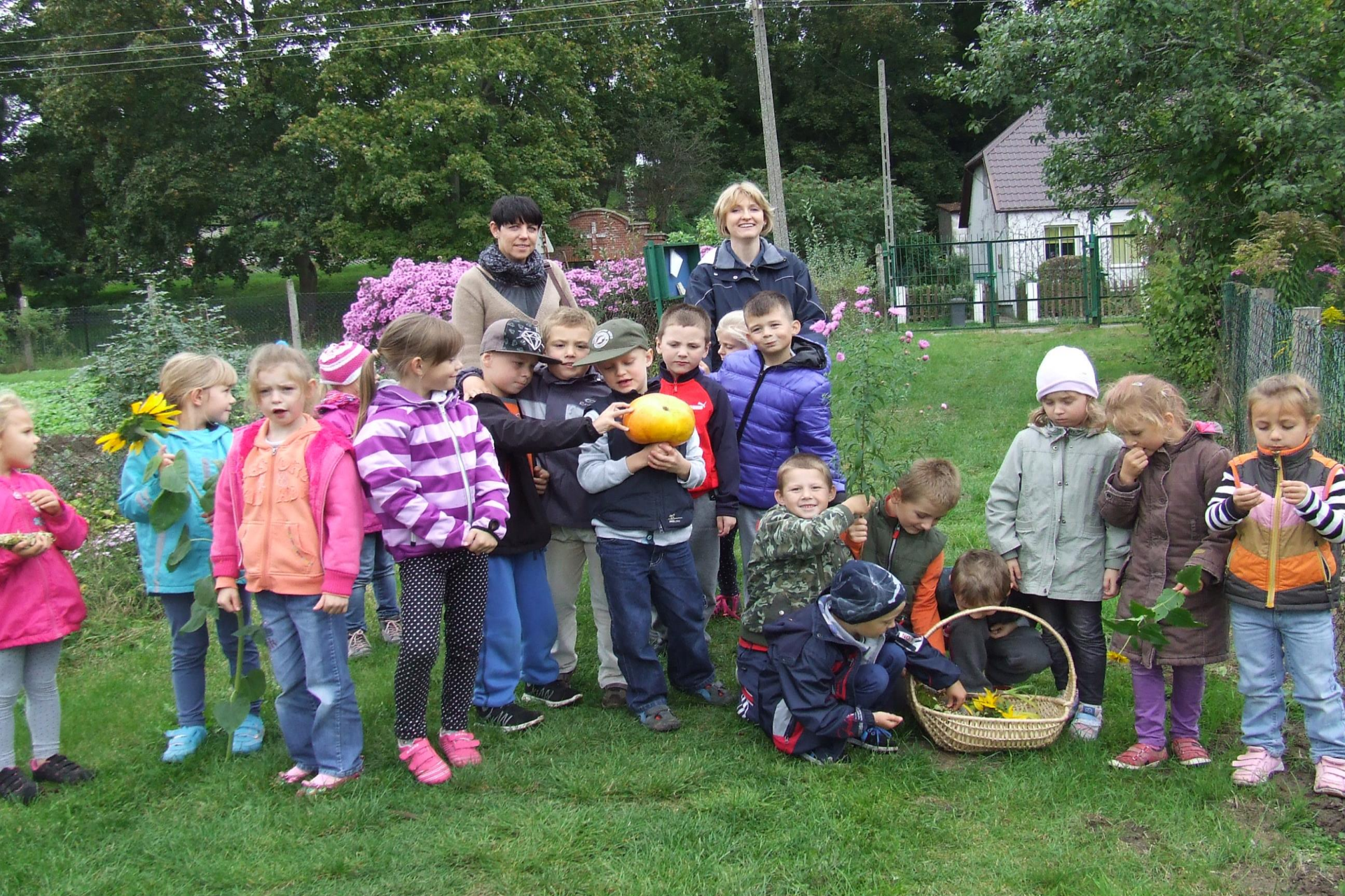
Z wizytą w ogrodzie