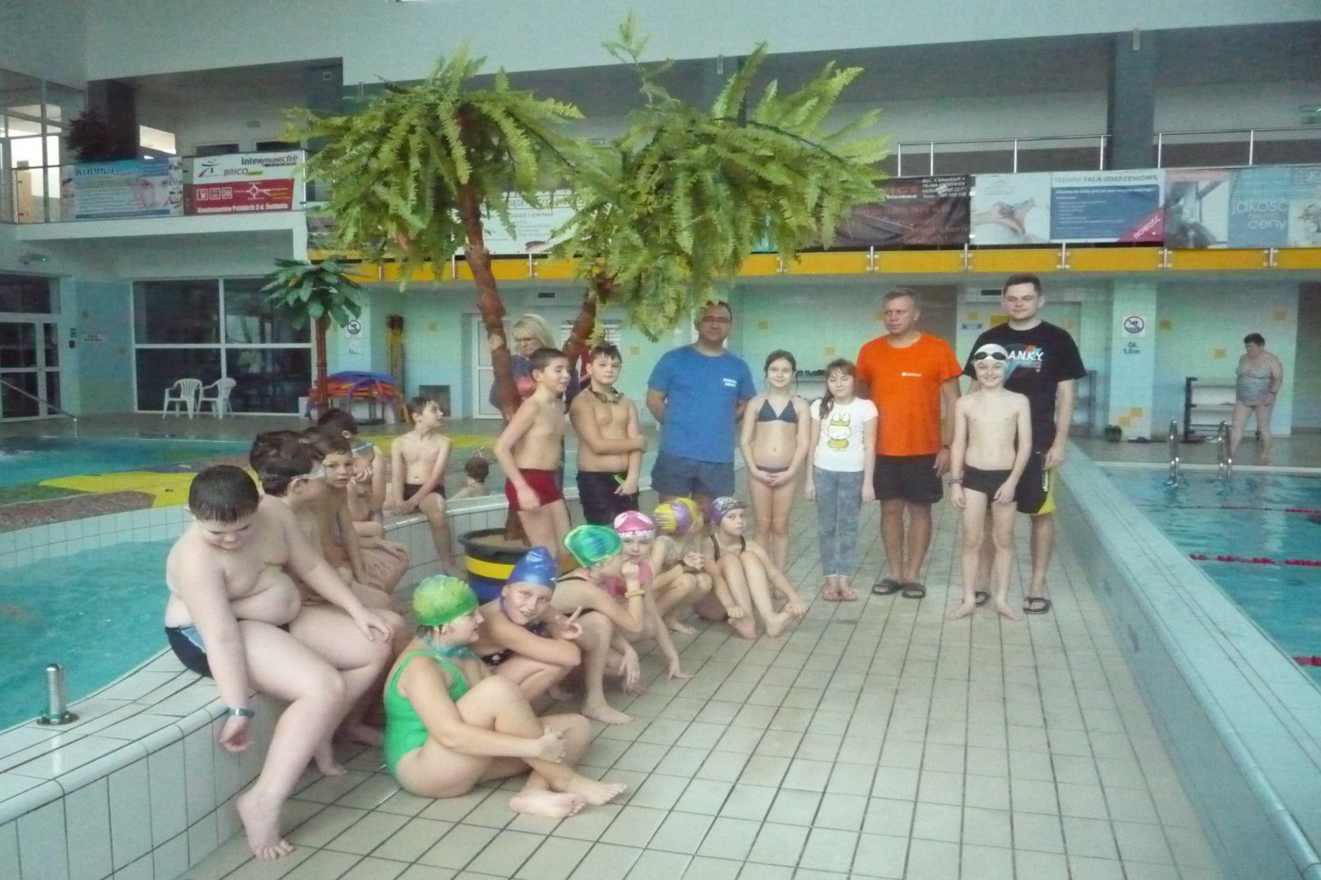
Wyjazd na basen – nauka pływania