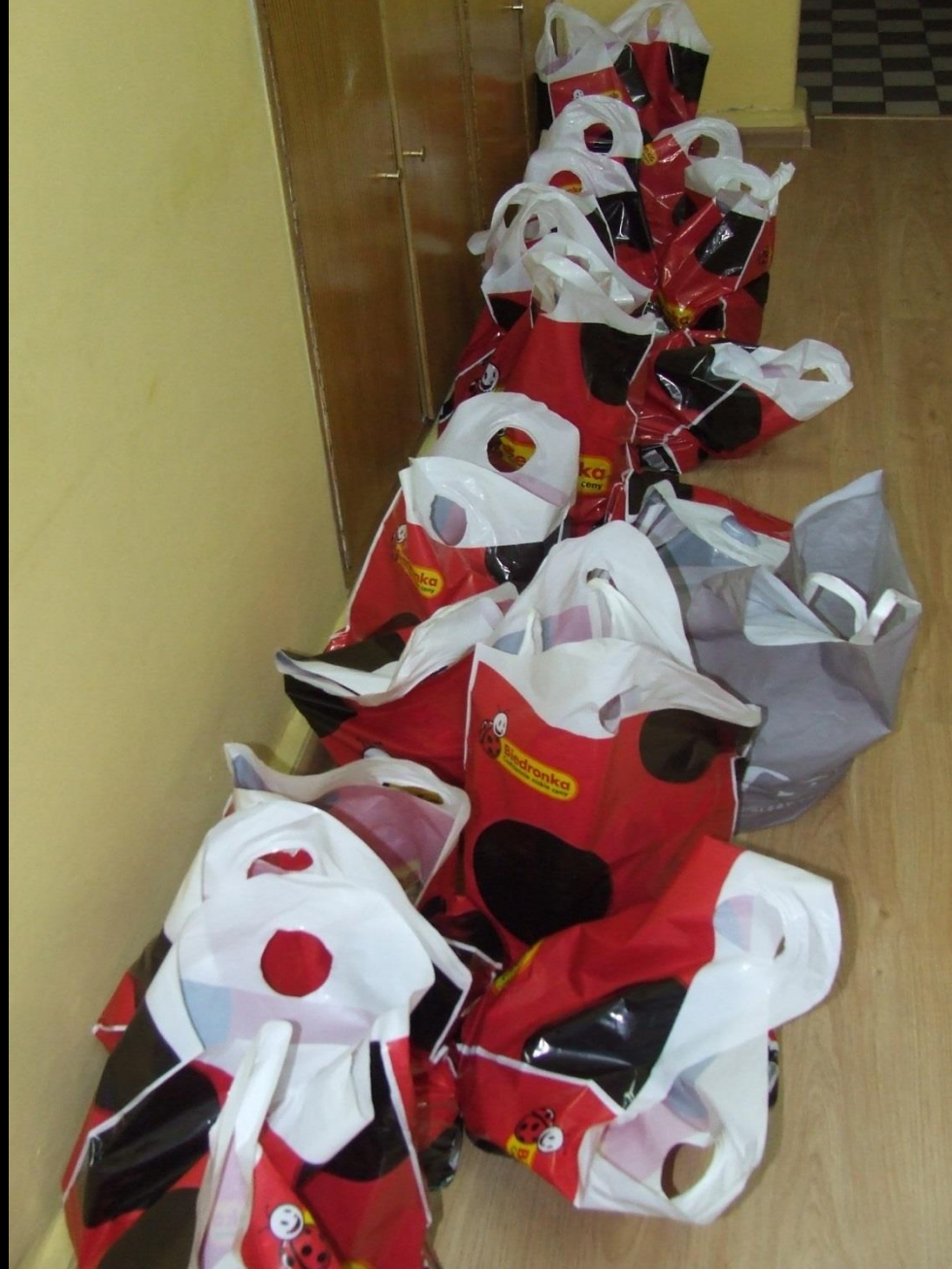
Świąteczne dary żywnościowe