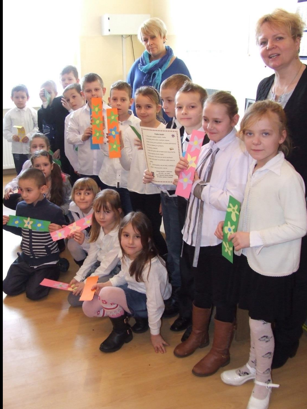
Pasowanie na czytelnika