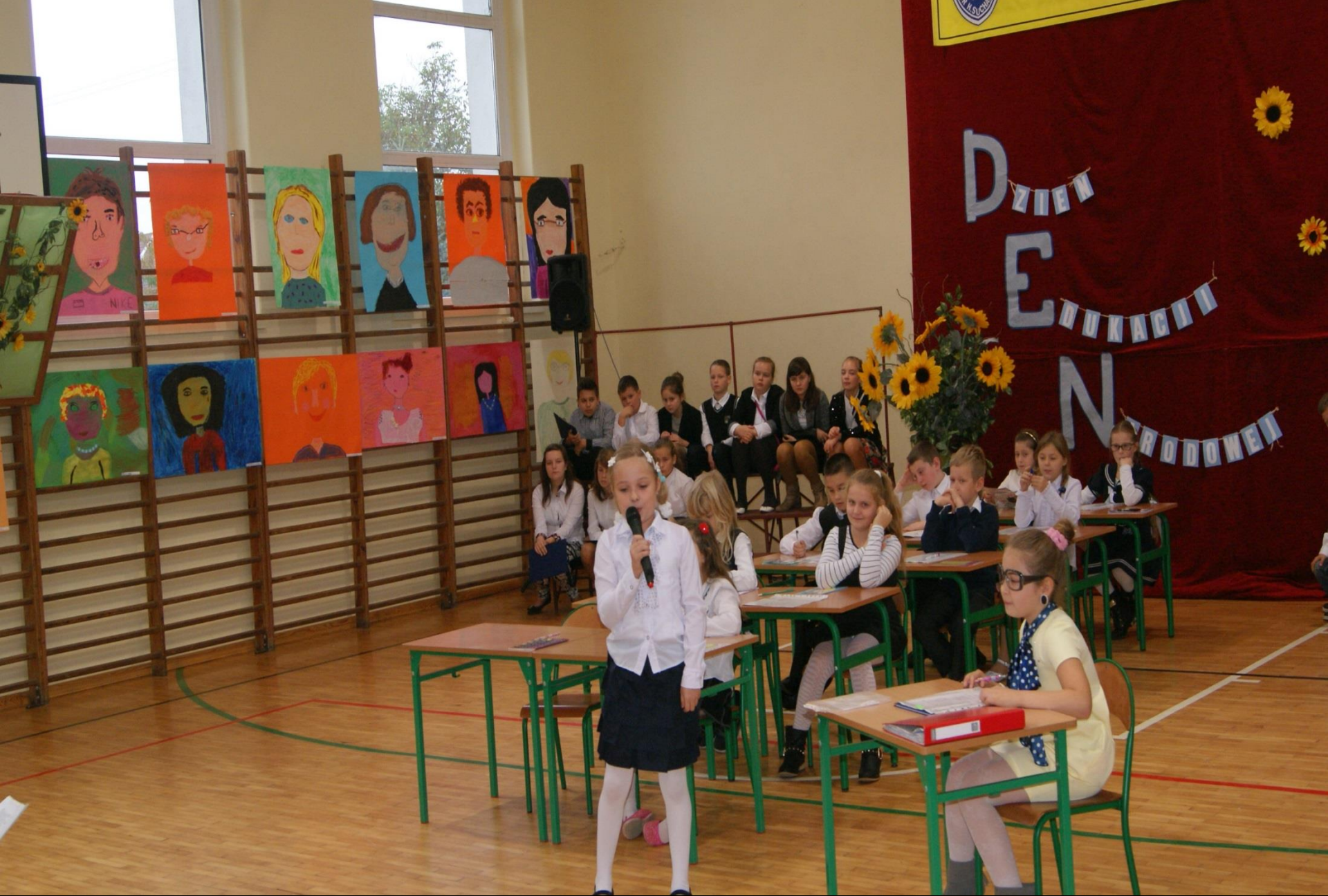
Dzień Edukacji Narodowej