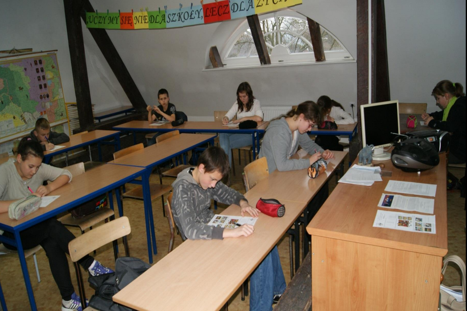
Konkurs języka angielskiego „The Bat Kid”