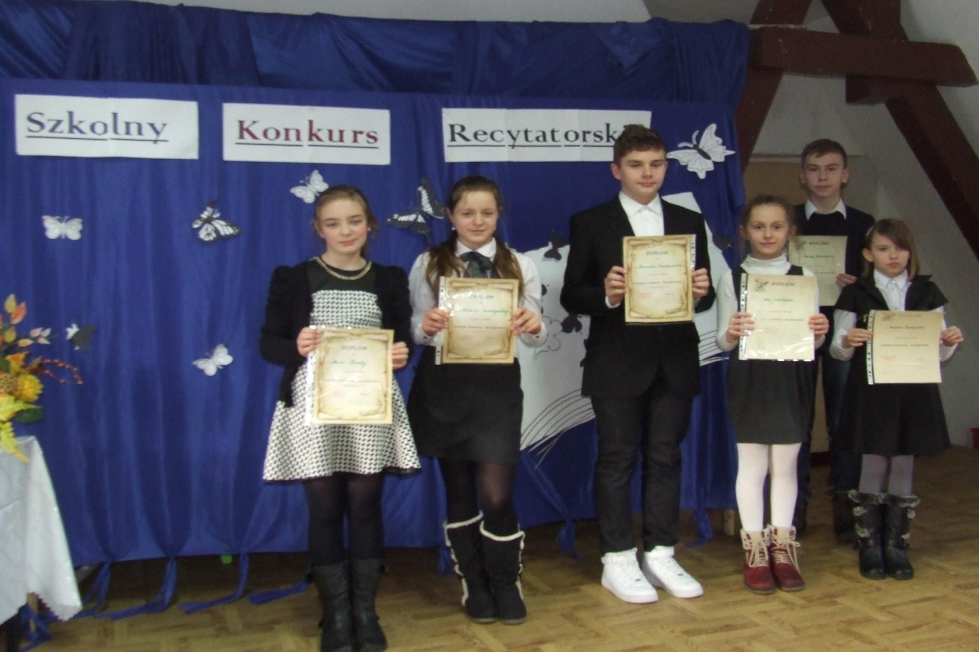
Konkurs recytatorski na etapie szkolnym – kl. IV - VI