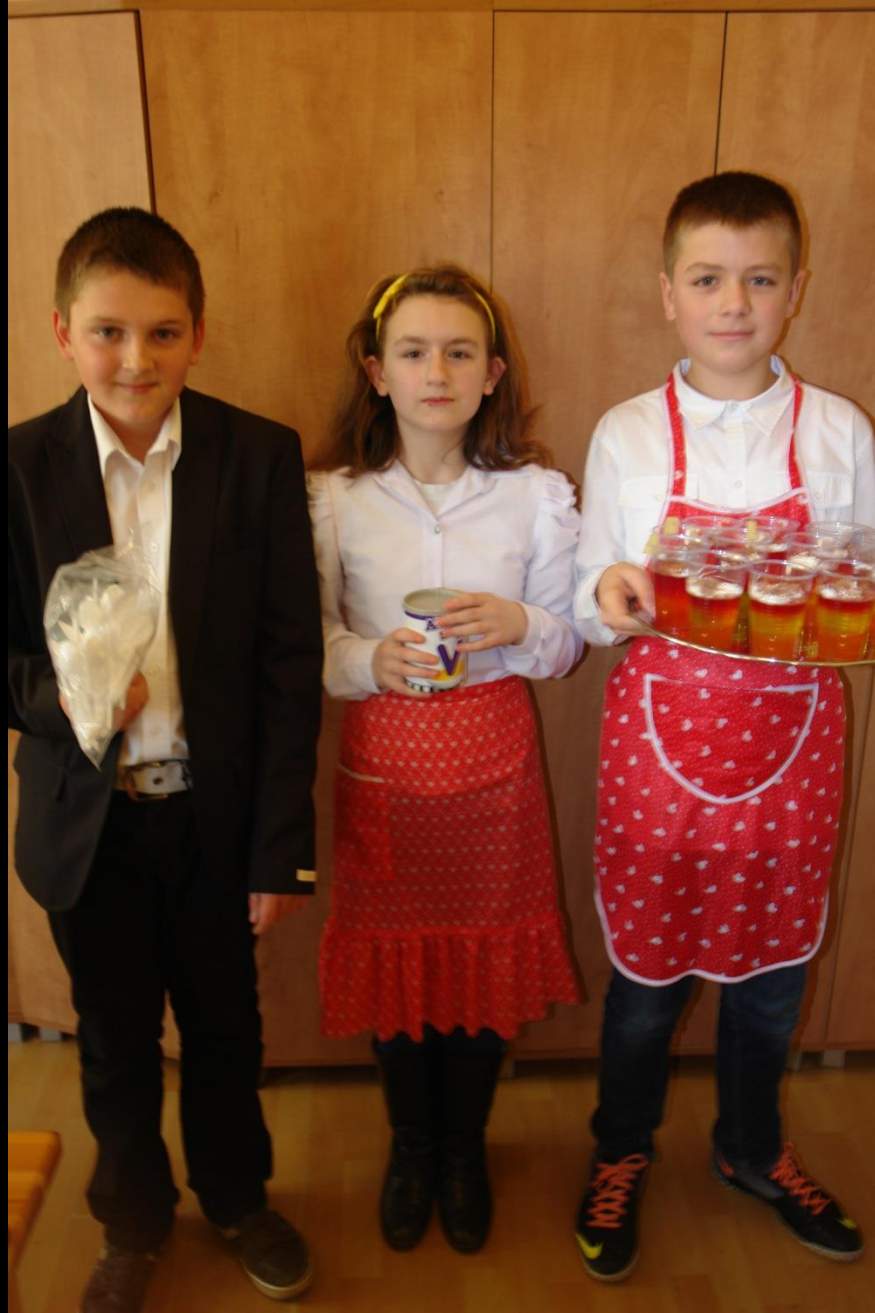
Sprzedaż galaretek – cel charytatywny