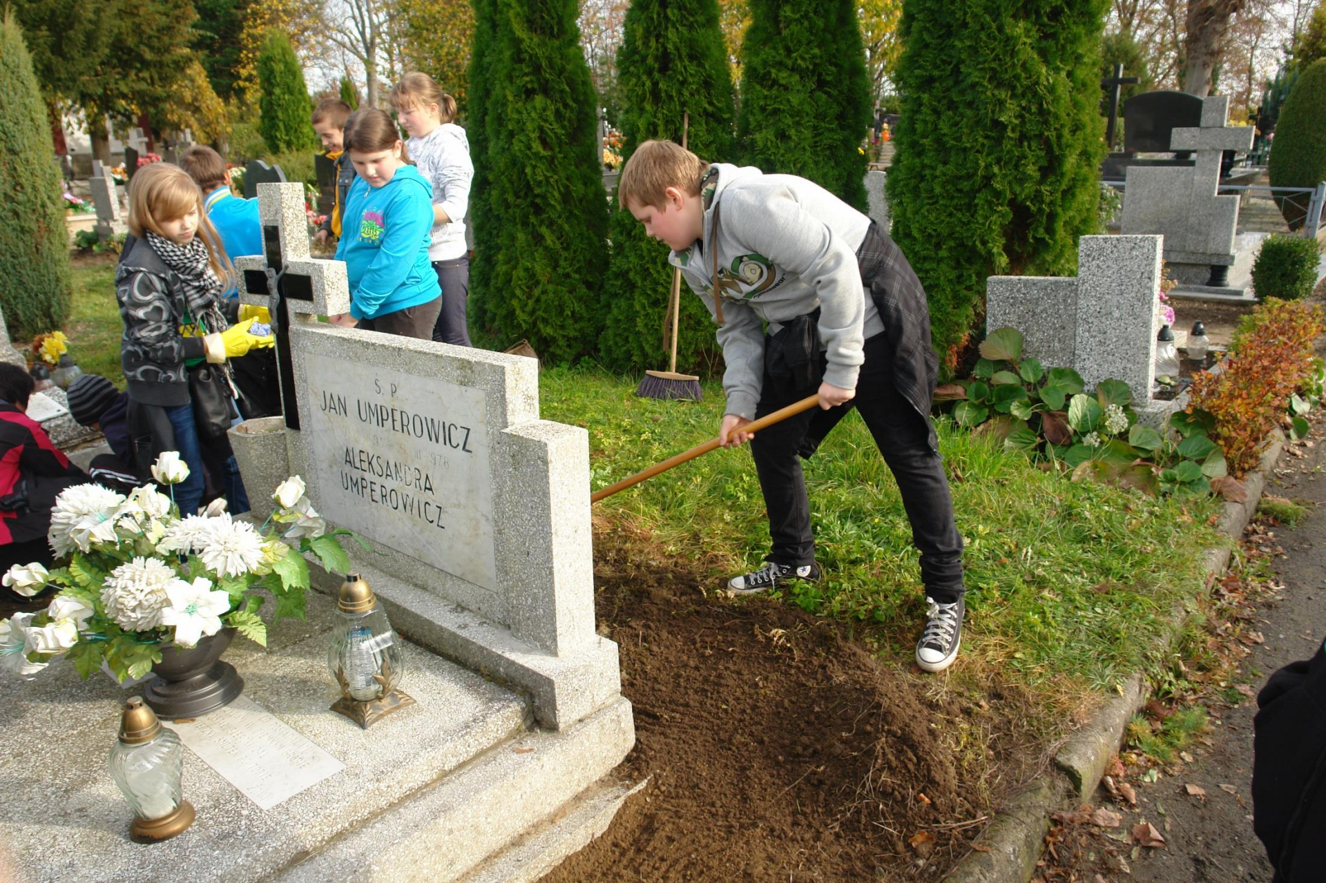
Odwiedzanie grobów zmarłych pracowników oświaty