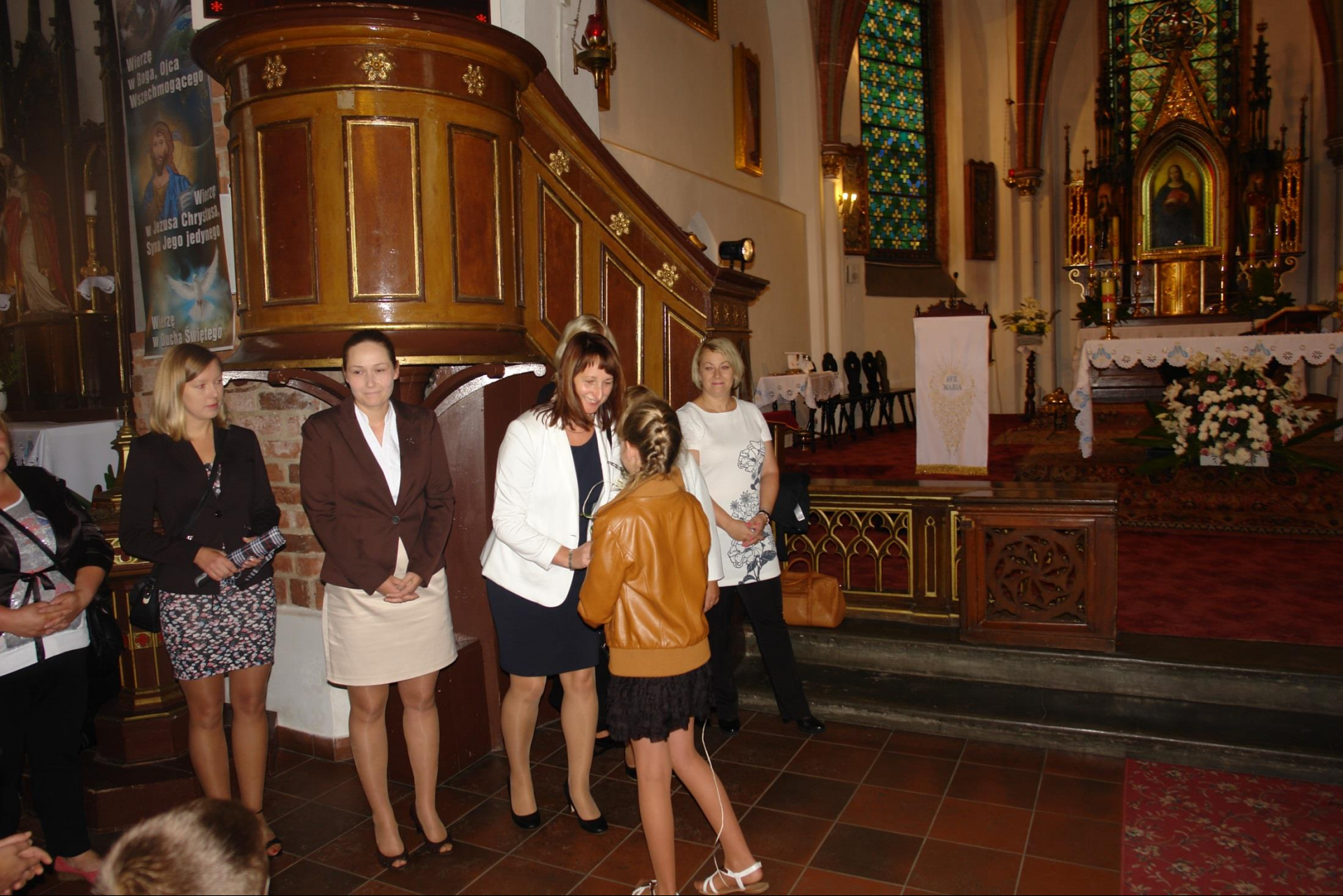
Rozpoczęcie roku szkolnego