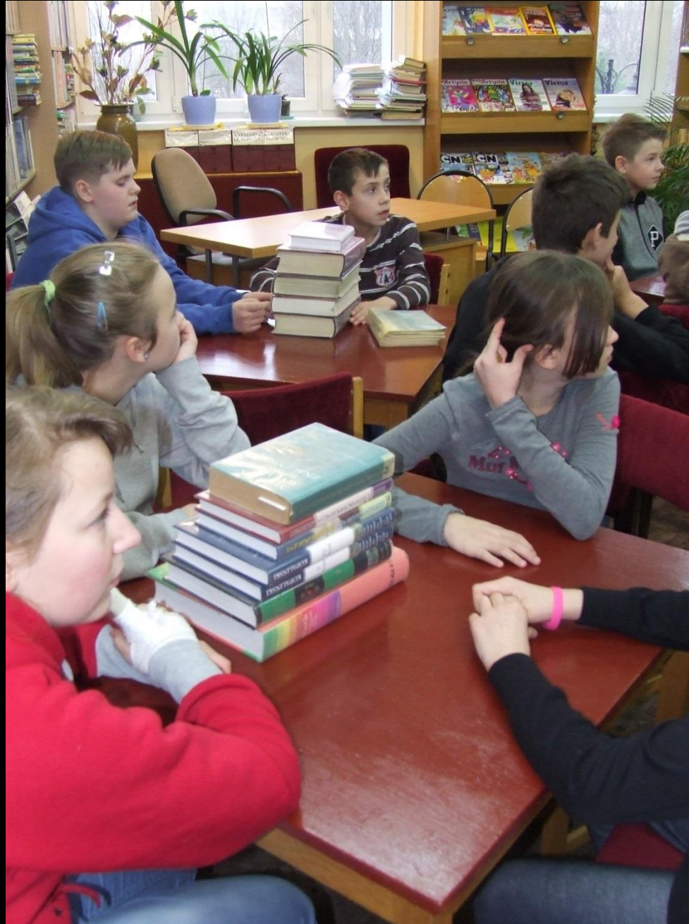
Lekcja j. polskiego w Bibliotece Miejskiej – kl. VI