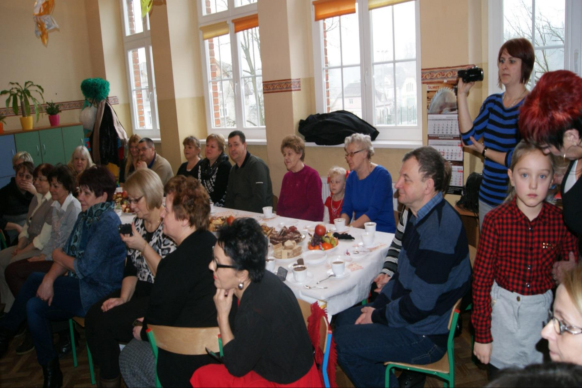
Dzień Babci i Dziadka