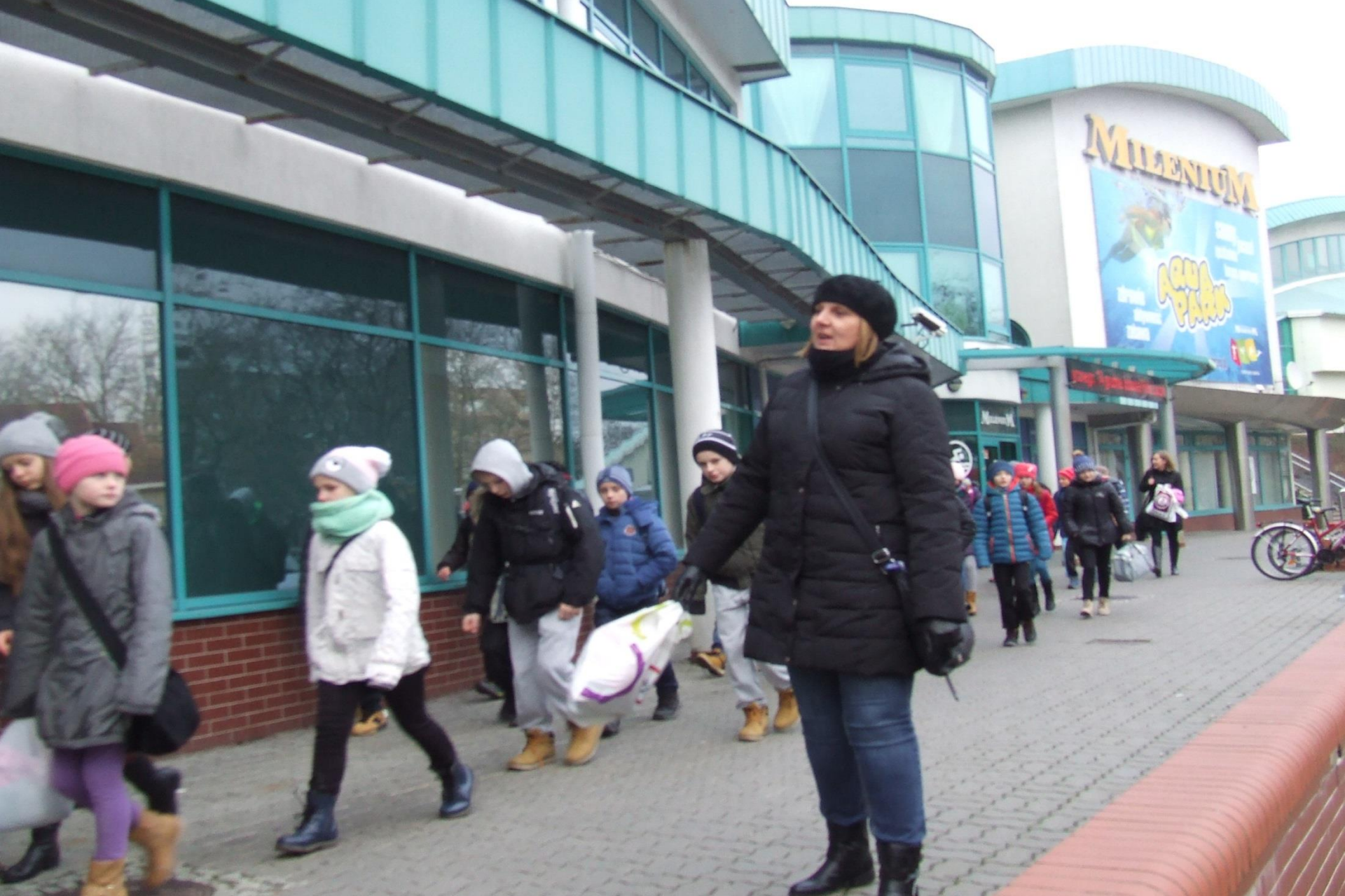
Wyjazd na basen do Kołobrzegu