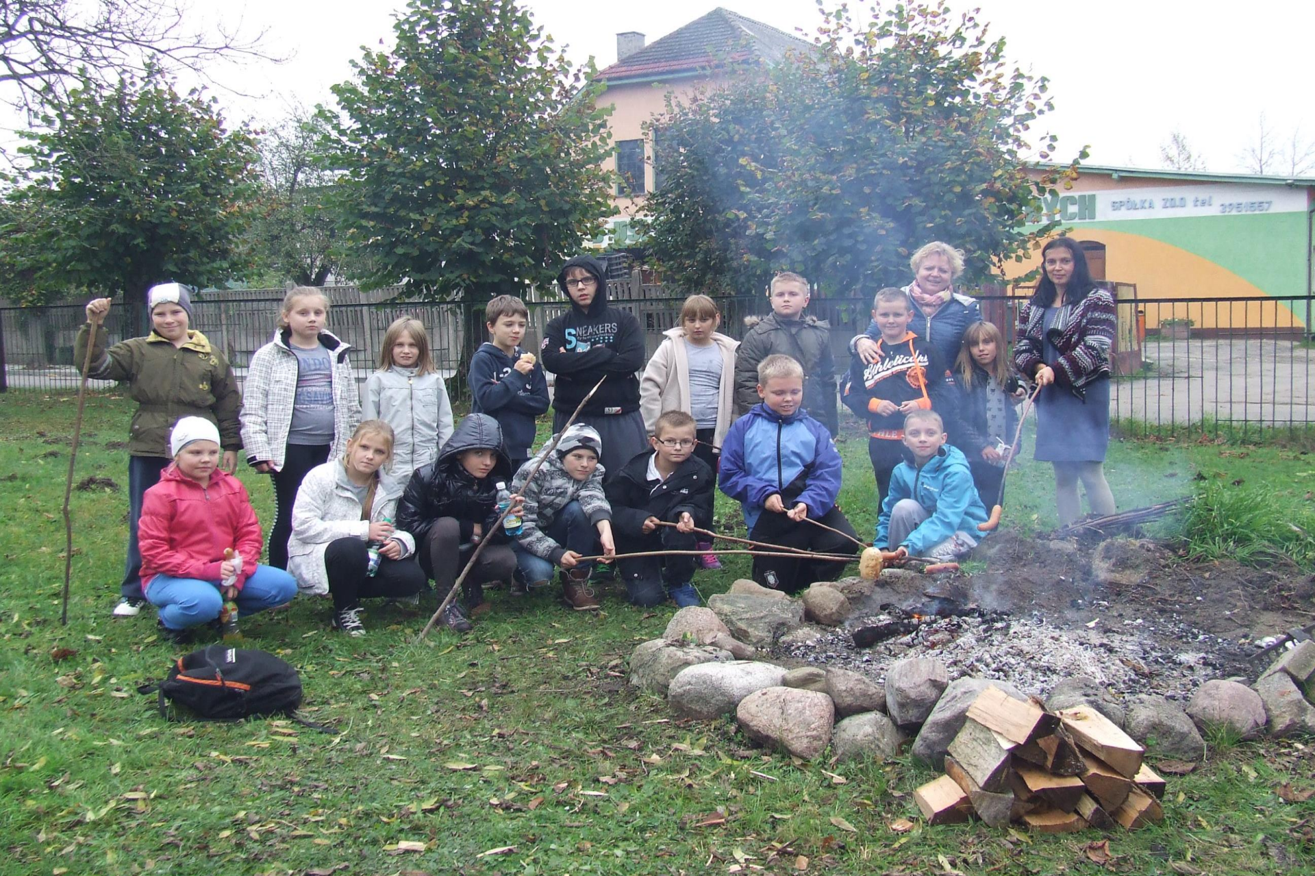
Spotkanie integracyjnej klasy IV c