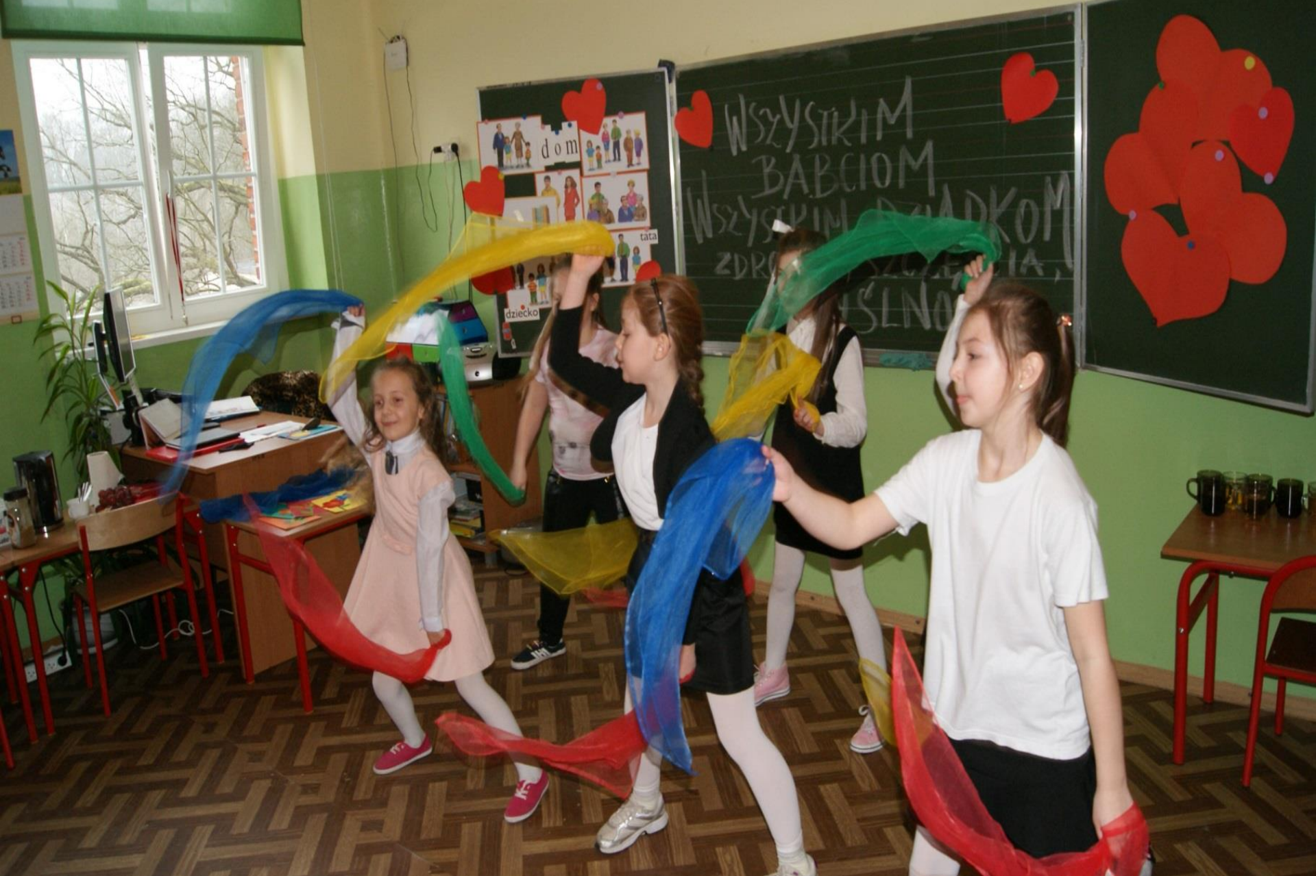
Dzień Babci i Dziadka