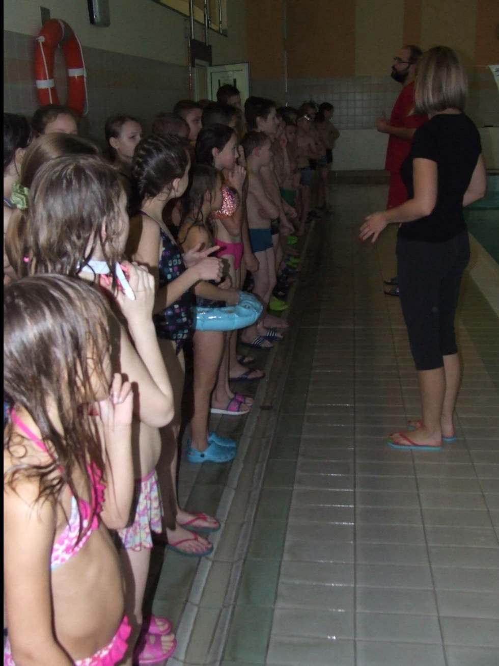
Wyjazd na basen do Kołobrzegu