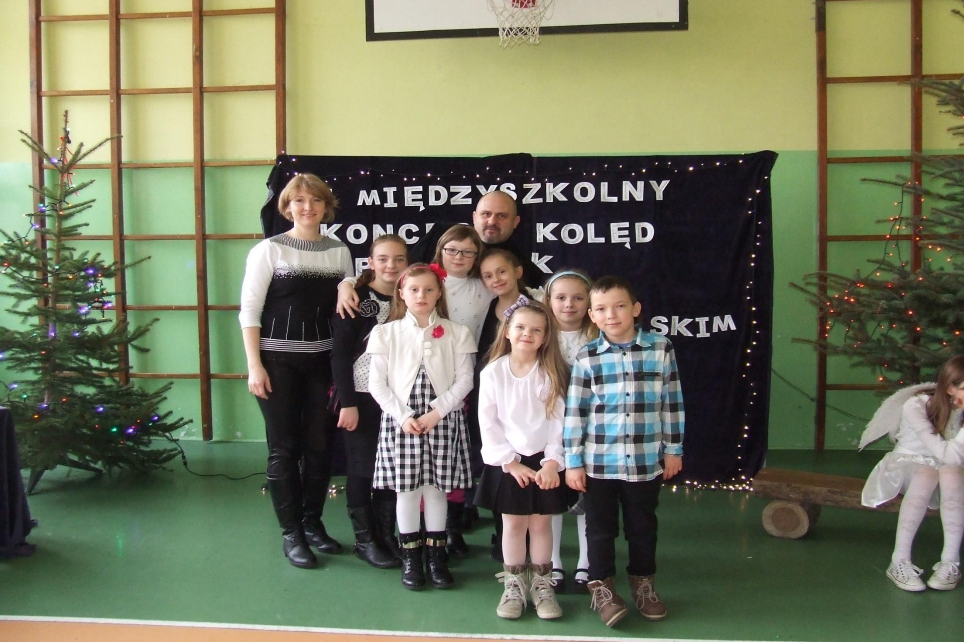
Międzyszkolny Konkurs Kolęd i Pastorałek w języku angielskim