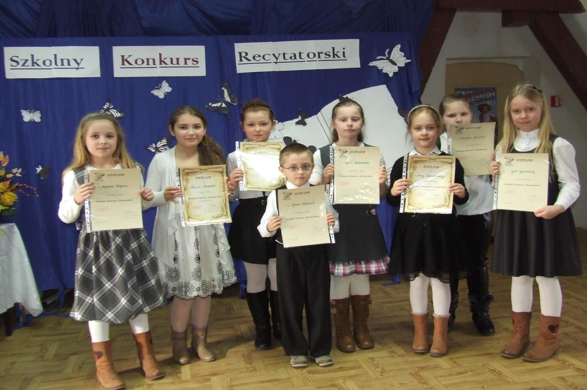
Konkurs recytatorski na etapie szkolnym kl. I - III