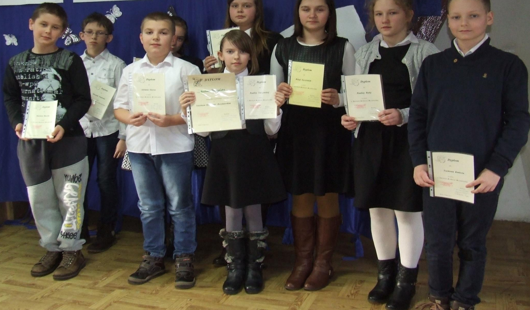
Konkurs recytatorski na etapie szkolnym – kl. IV - VI