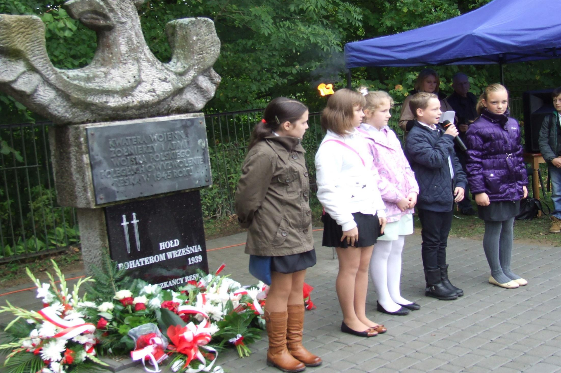
Rocznica powstania Państwa Podziemnego