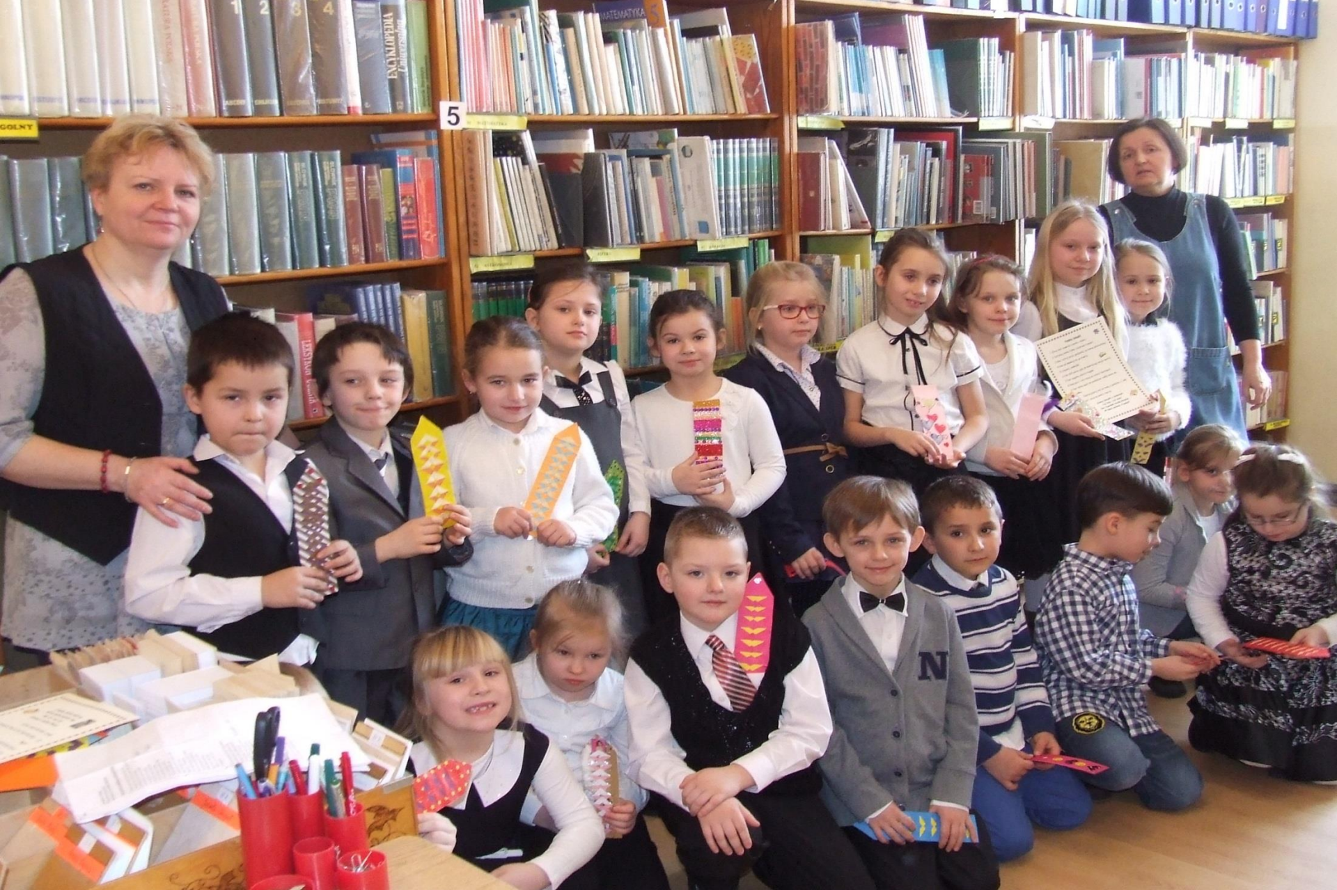
Pasowanie na czytelnika