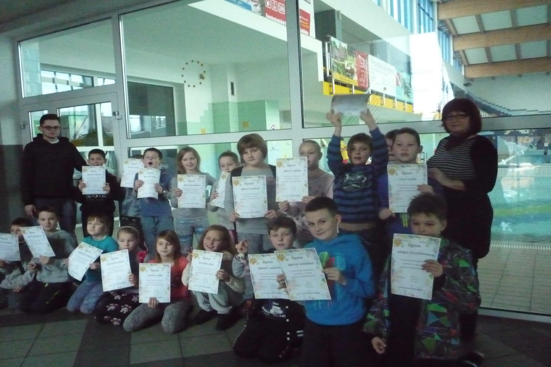
Wyjazd na basen