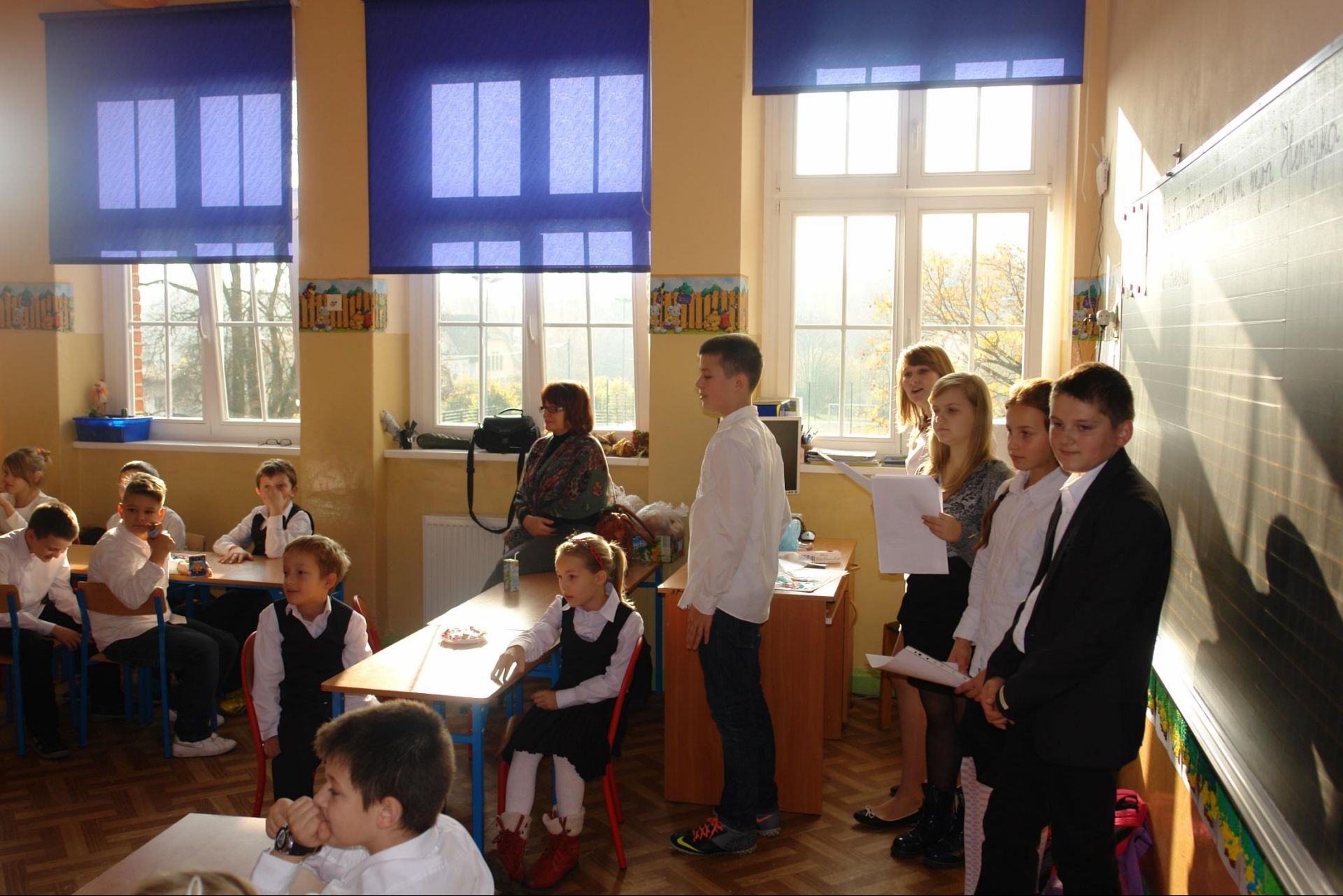
Otrzęsiny III klas