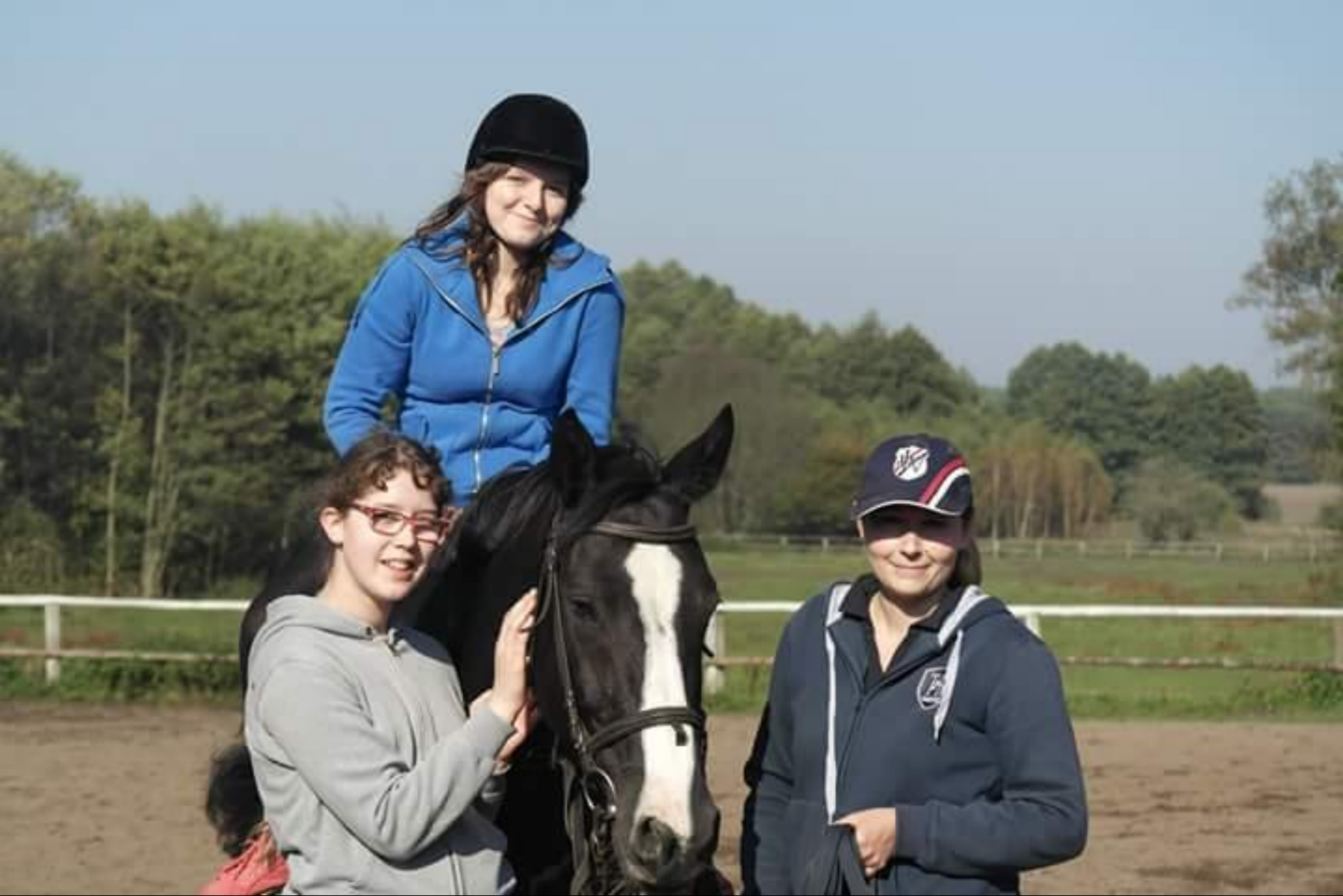
Program „Podróże Paddingtona”