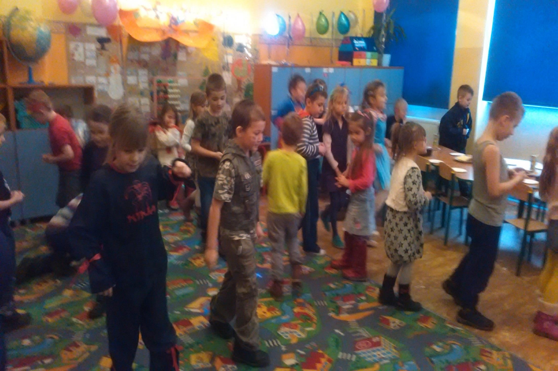
Współpraca z Przedszkolem Miejskim – wizyta sześciolatków