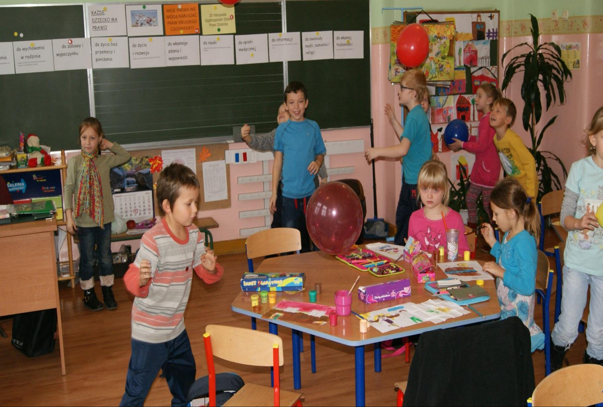
Dzień Praw Dziecka