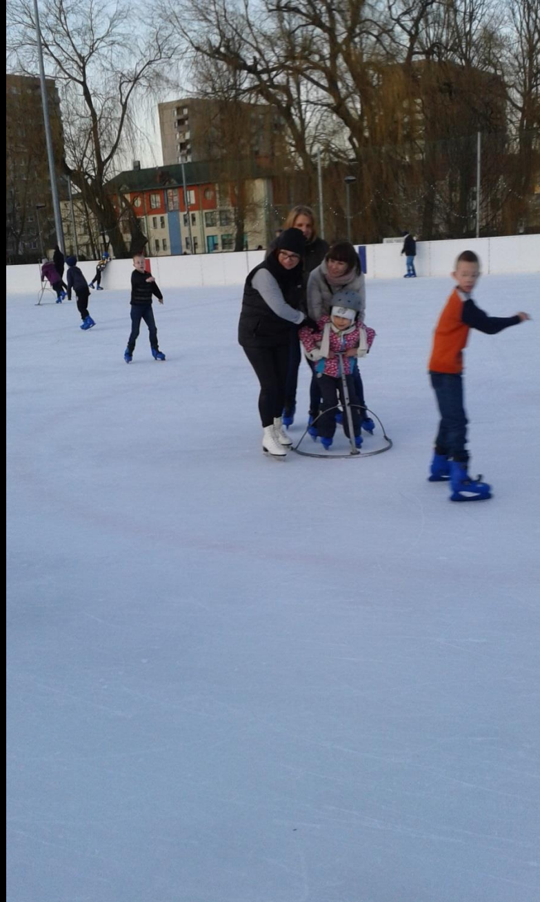
Lodogryf w Kołobrzegu