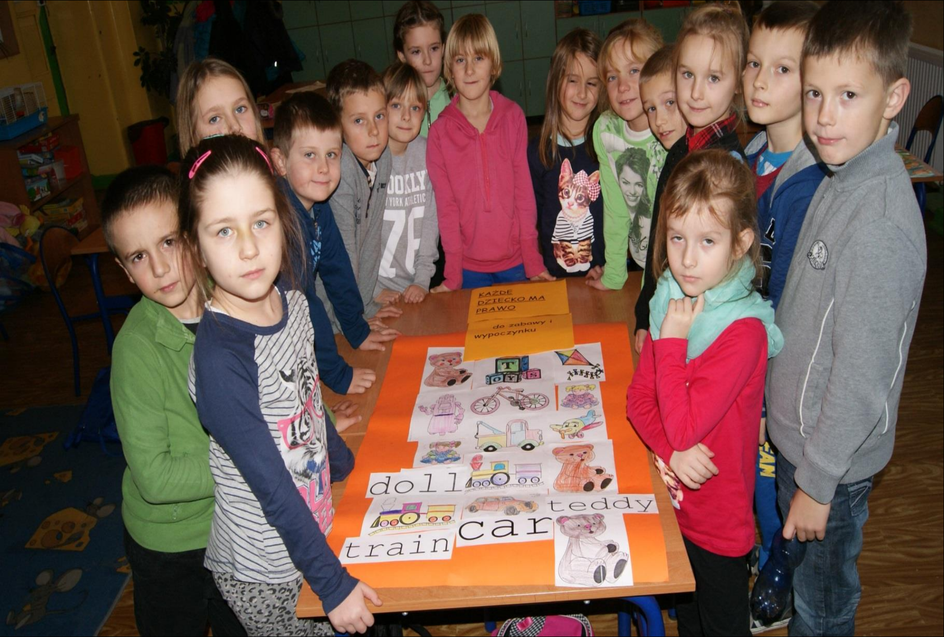
Dzień Praw Dziecka