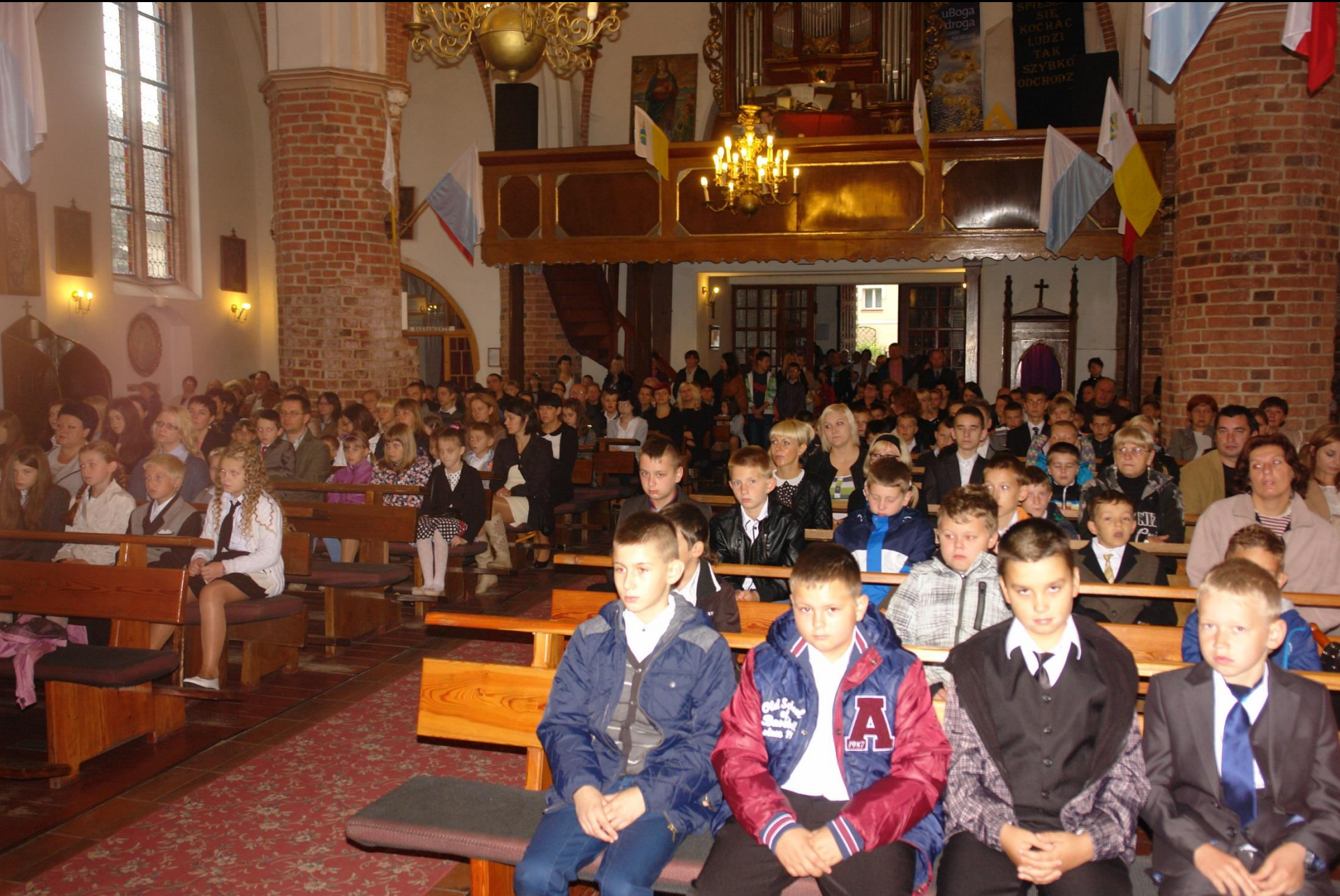
Rozpoczęcie roku szkolnego