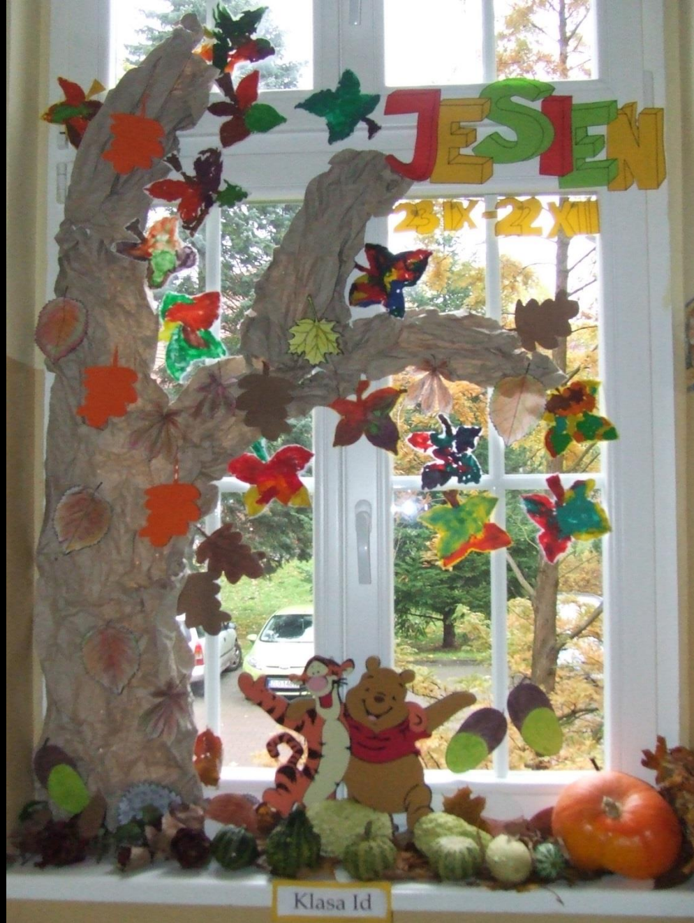
Konkurs „Jesienne okno”