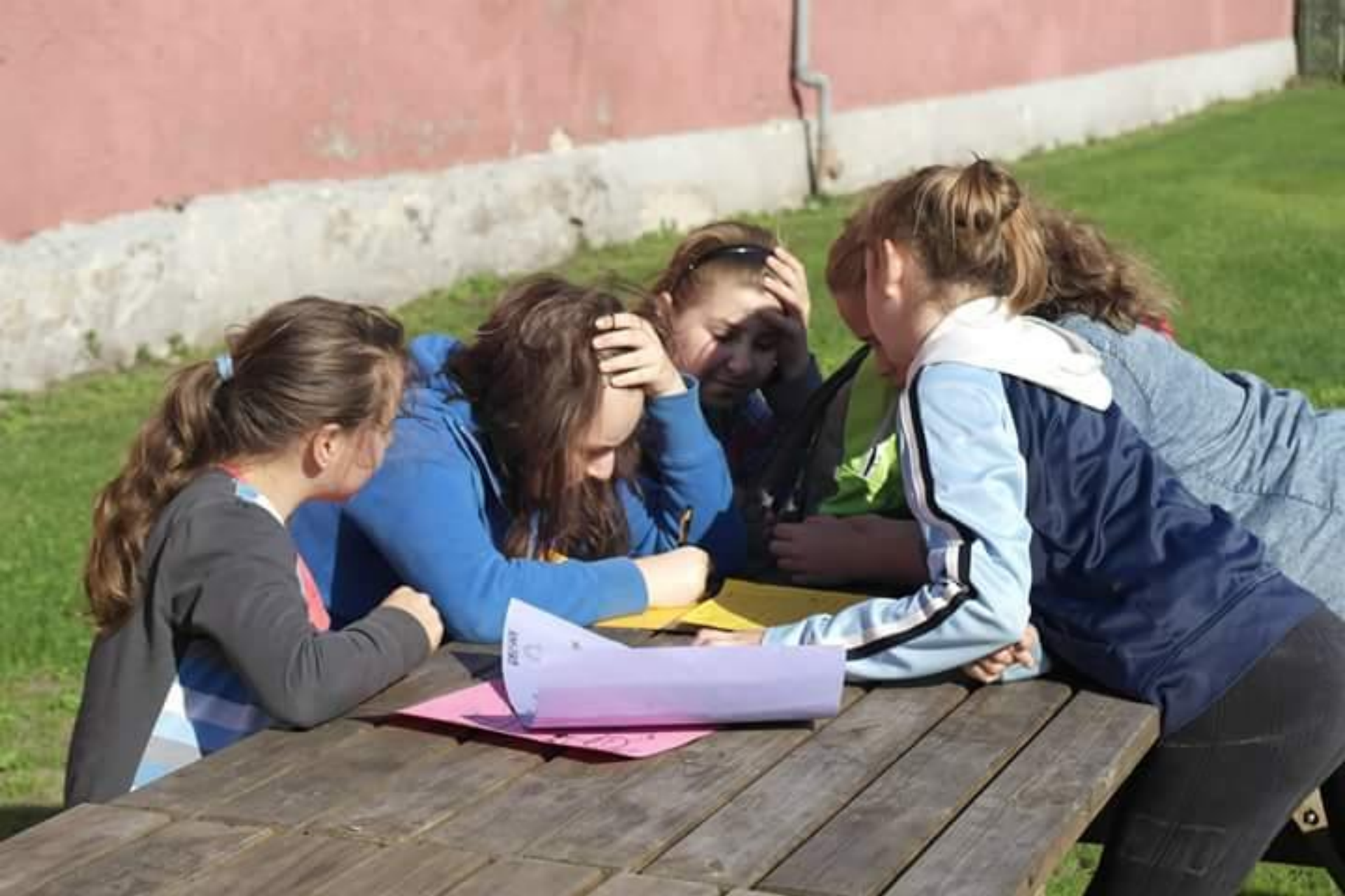
Program „Podróże Paddingtona”