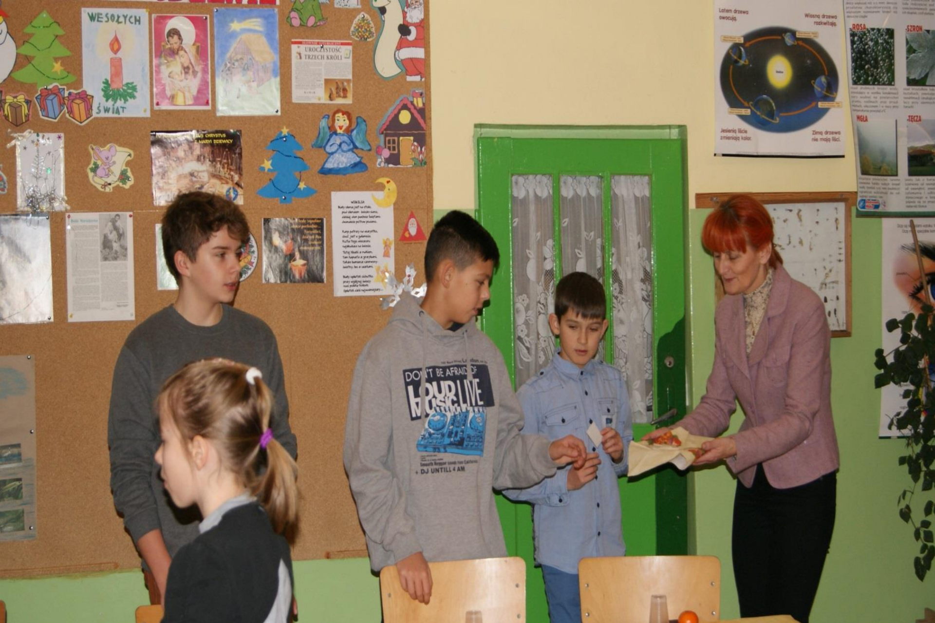
Wigilia szkolnego koła „Caritas”