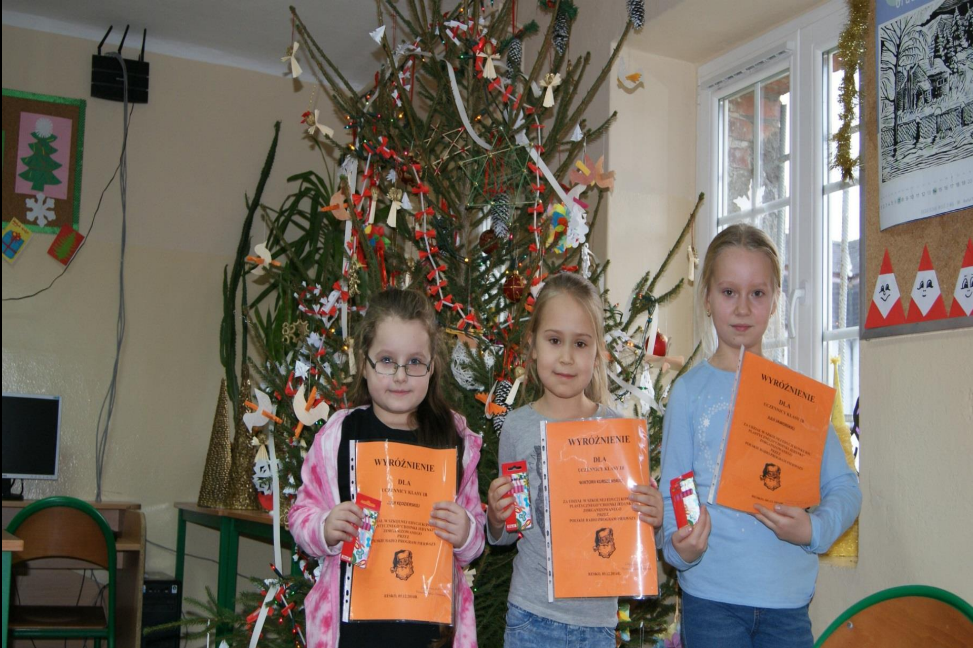
Wyróżnienie w konkursie „Choinki Jedynki”