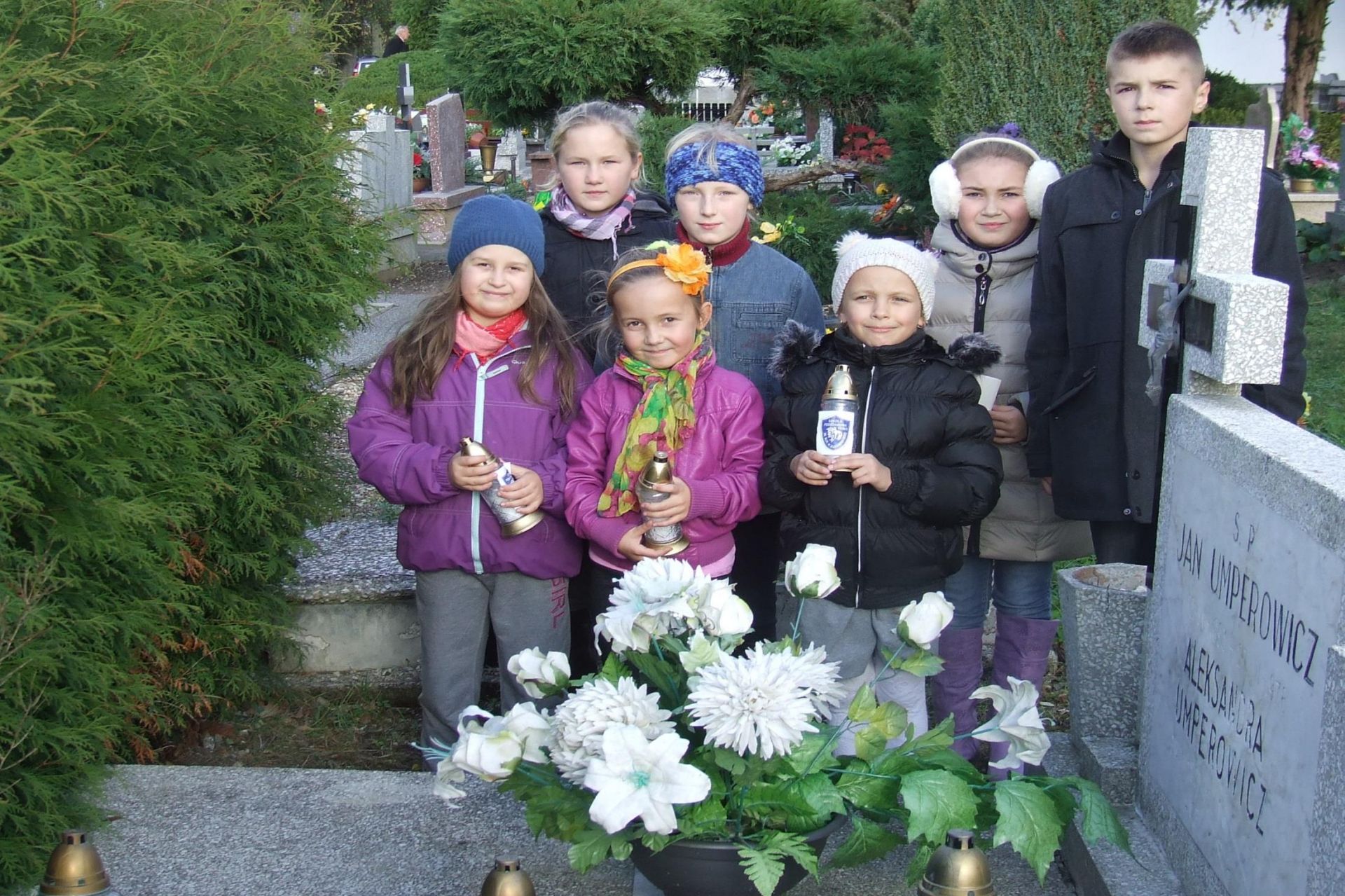
Odwiedzanie grobów zmarłych pracowników oświaty