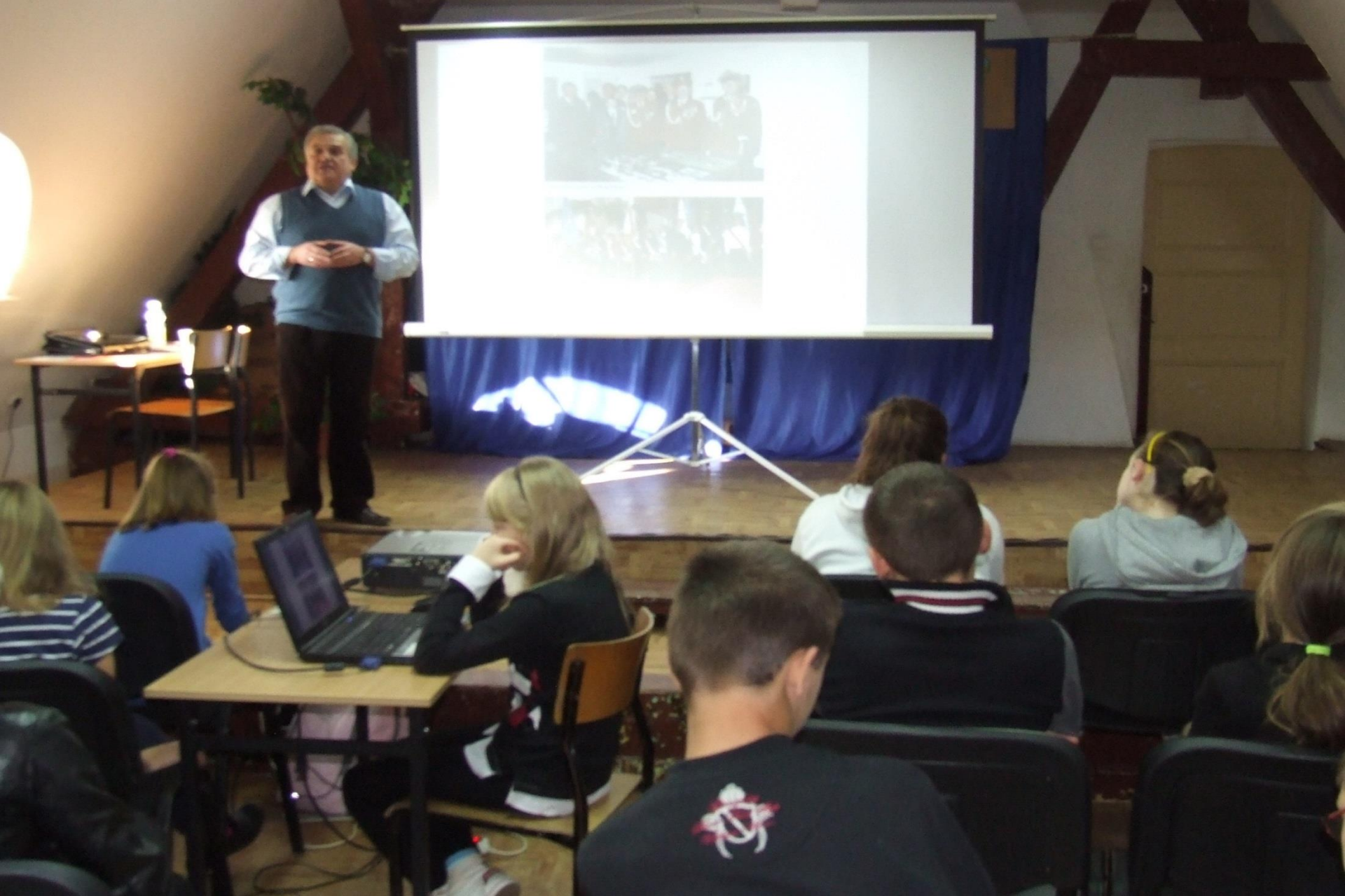
Prelekcja o Klubie Szkół Westerland