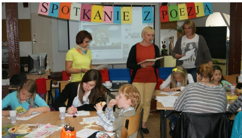
Wieczorek poetycki „Lato w poezji i w piosence”.