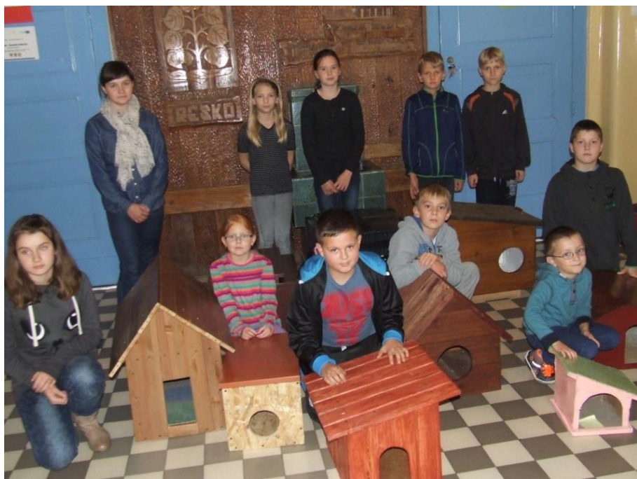
Budka dla bezdomnego kota.