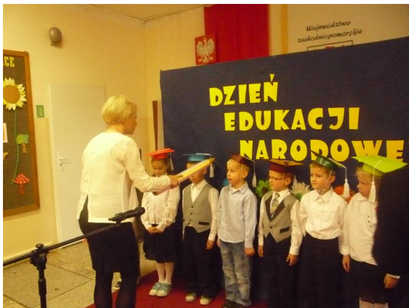
Pasowanie na ucznia.