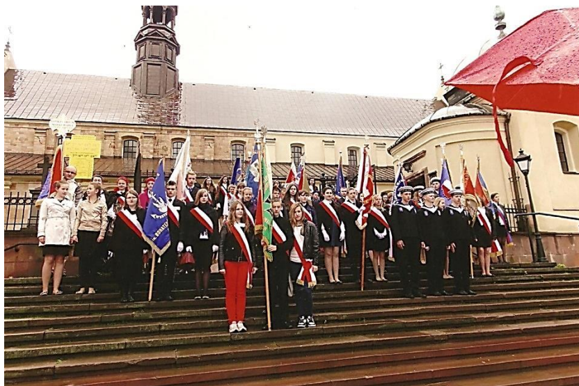
XXXI Sympozjum Kielce 2014.