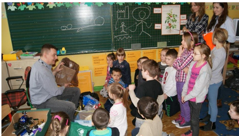
Butelka, papierek, puszka, obierek - zużywamy odpady.