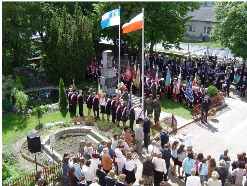
XXIII Sympozjum w Ujeździe 2006.

Przedstawiciele szkoły uczestniczyli w wielu Sympozjach Klubu Szkół Westerplatte, organizowanych w innych miejscowościach.