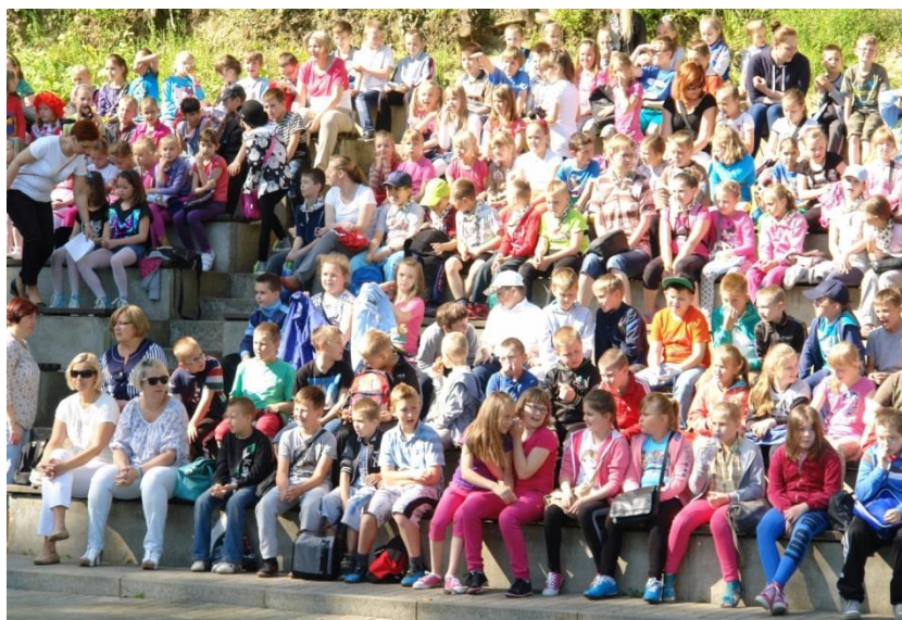
Zakończenie projektu Leonardo w Radowie Małym.