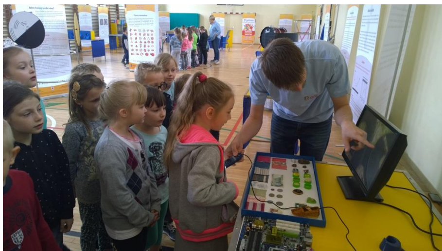
Akademia Odkrywców - pokaz eksperymentów na sali gimnastycznej - maj 2015.