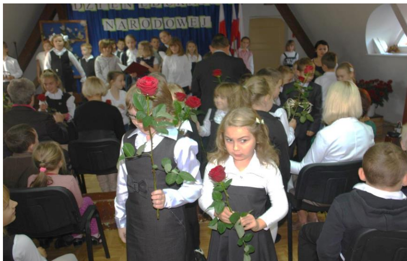
Róże dla nauczycieli ufundowane z okazji DEN.