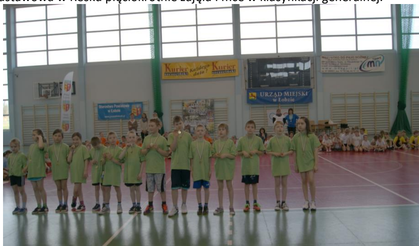
V Turniej Gwiazdeczek Olimpijskich w Łobzie – kwiecień 2013 - I miejsce SP Resko.

W ciągu siedmiu edycji Turnieju Gwiazdeczek Olimpijskich, dla kl. I-III, Szkoła Podstawowa w Resku pięciokrotnie zajęła I mce w klasyfikacji generalnej.