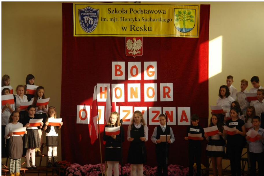
Święto Patrona – listopad 2014r.