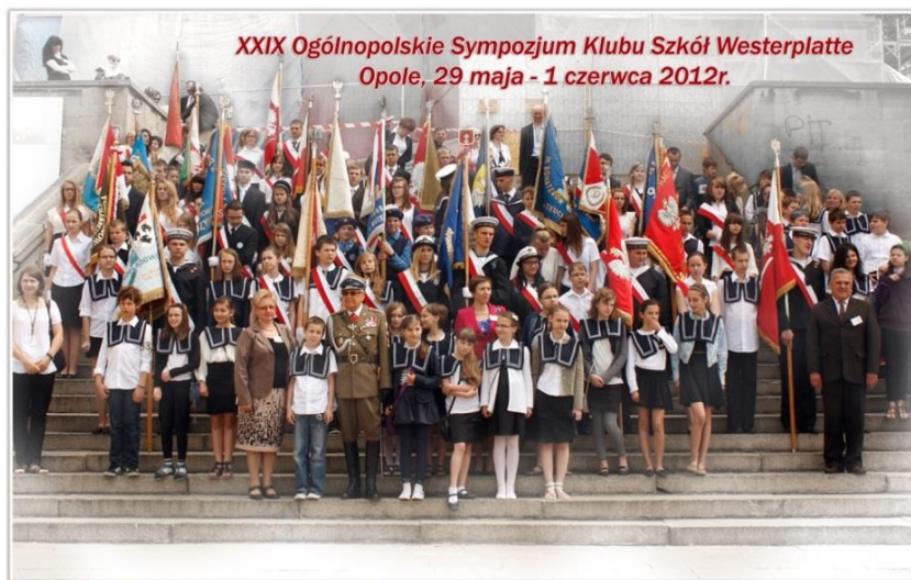
XXIX Sympozjum Opole 2012.