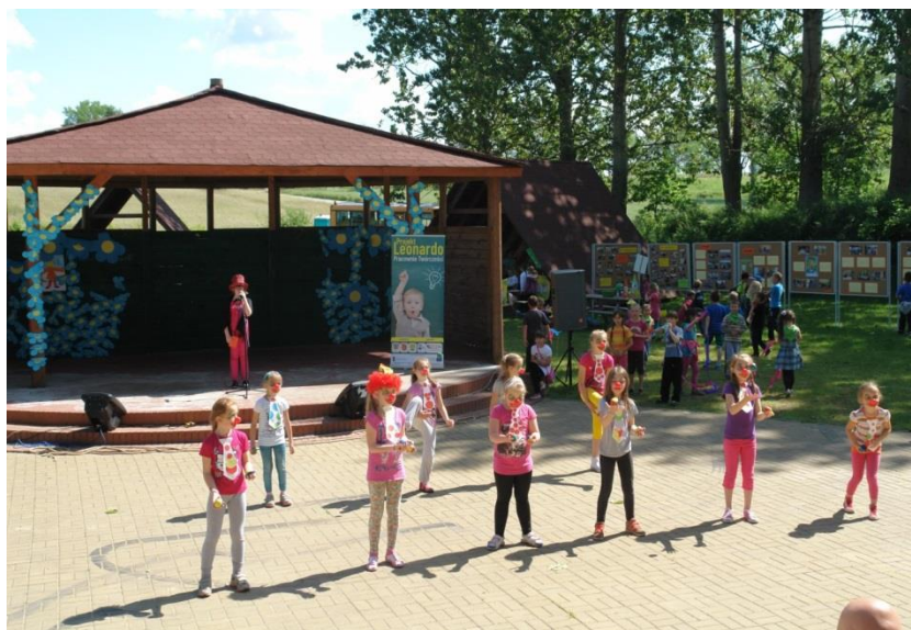
Zakończenie projektu Leonardo w Radowie Małym – pokazy cyrkowe.