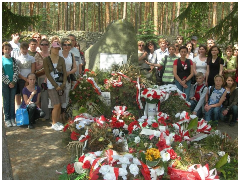
XXV Sympozjum Odrzywół 2008.