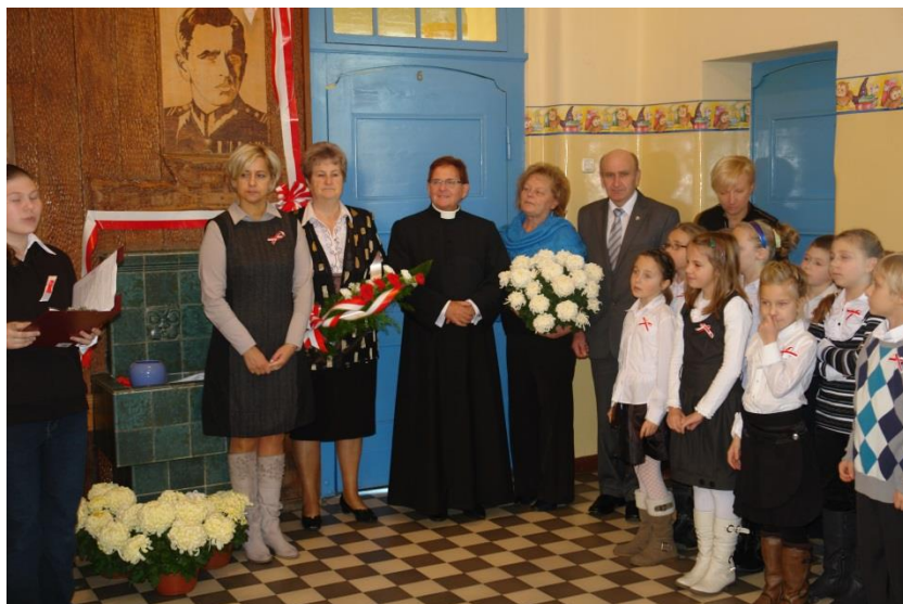
Święto Patrona – listopad 2011r.