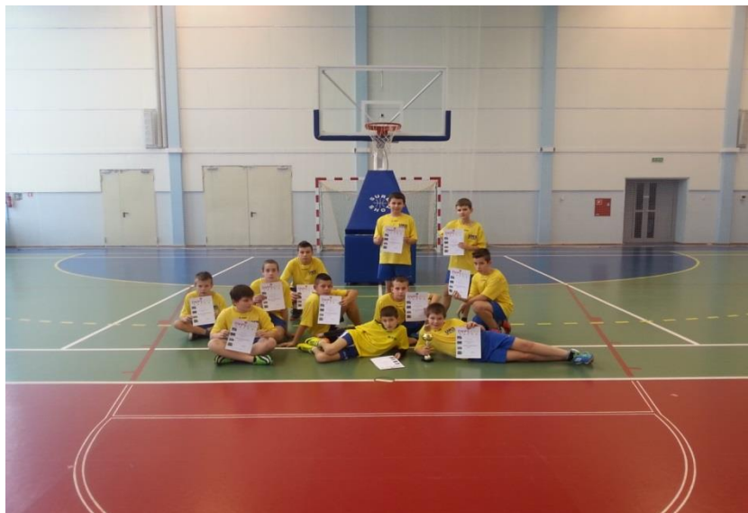
I miejsce w Mini Piłce Koszykowej.

W ciągu siedmiu edycji Turnieju Gwiazdeczek Olimpijskich, dla kl. I-III, Szkoła Podstawowa w Resku pięciokrotnie zajęła I mce w klasyfikacji generalnej.