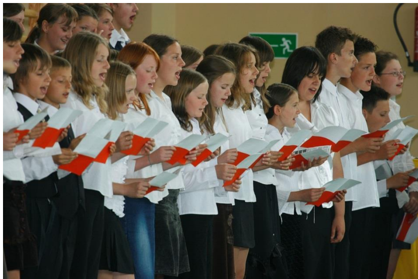
XXIV Sympozjum Klubu Szkół Westerplatte w Resku.

Przedstawiciele szkoły uczestniczyli w wielu Sympozjach Klubu Szkół Westerplatte, organizowanych w innych miejscowościach.