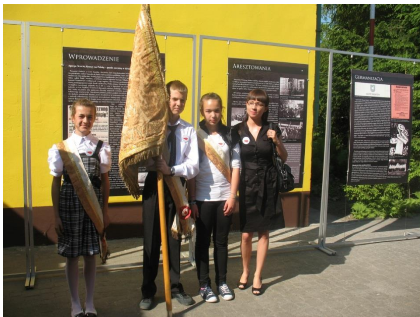
XXVIII Sympozjum Dąbrówka Malborska 2011.