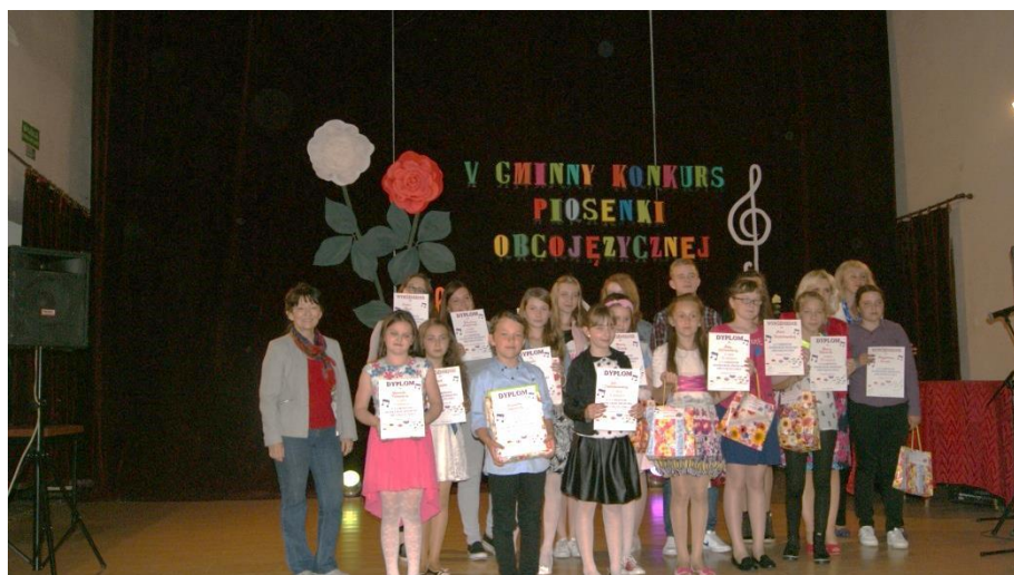
Gminny Konkurs Piosenki Obcojęzycznej w Centrum Kultury – czerwiec 2015.