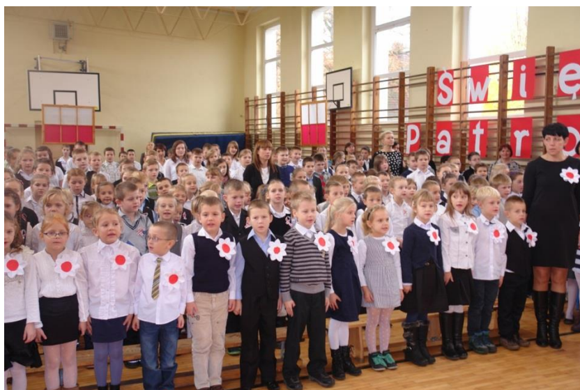
Święto Patrona – listopad 2014r.