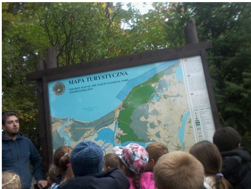
Wyjazd studyjny do Wolina.

Zajęcia odbywały się w ramach następujących pracowni: Wiedzy I, Wiedzy II (kl. I – III), Projektu Edukacyjnego, Dziennikarstwa, Nauki, Języka Obcego, Mobilnej Edukacji (kl. IV – VI).