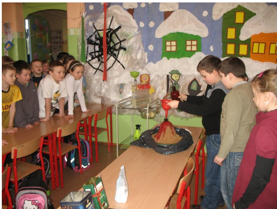
W pracowni Wiedzy – Witajcie w laboratorium.