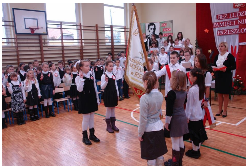
Ślubowanie klas III w Dniu Patrona.