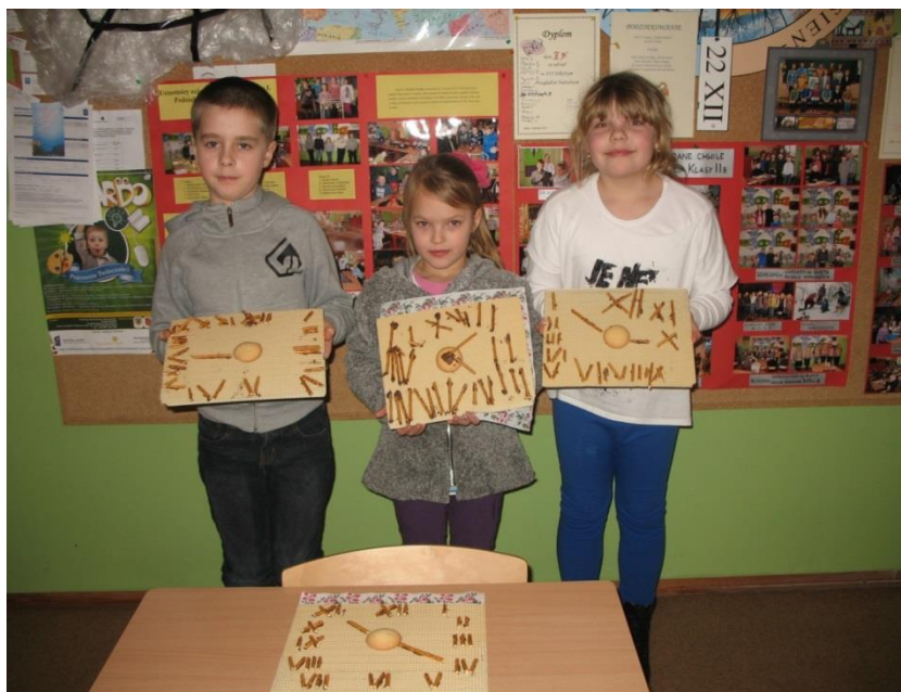
Ciasteczkowy zegar, czyli odmierzanie czasu.