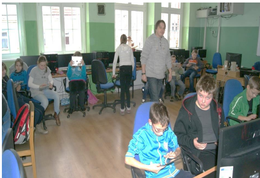
W pracowni Mobilnej Edukacji.