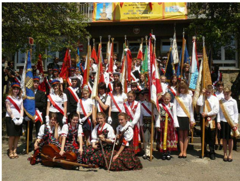
XXVII Sympozjum Jabłonka 2010.