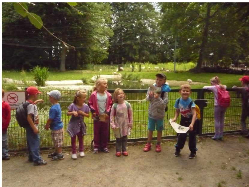
Z wizytą w ZOO (Ueckermünde).