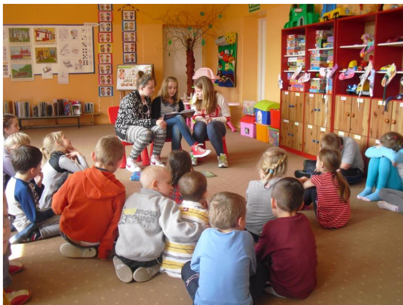
Ogólnopolska akcja: „Cała Polska czyta Dzieciom” (spotkanie w przedszkolu).

W czerwcu bieżącego roku SU włączył się w obchody 25-lecia Samorządu Terytorialnego. Podczas uroczystej akademii zaprezentował montaż słowno-muzyczny pt. „Polska - moja Ojczyzna”.