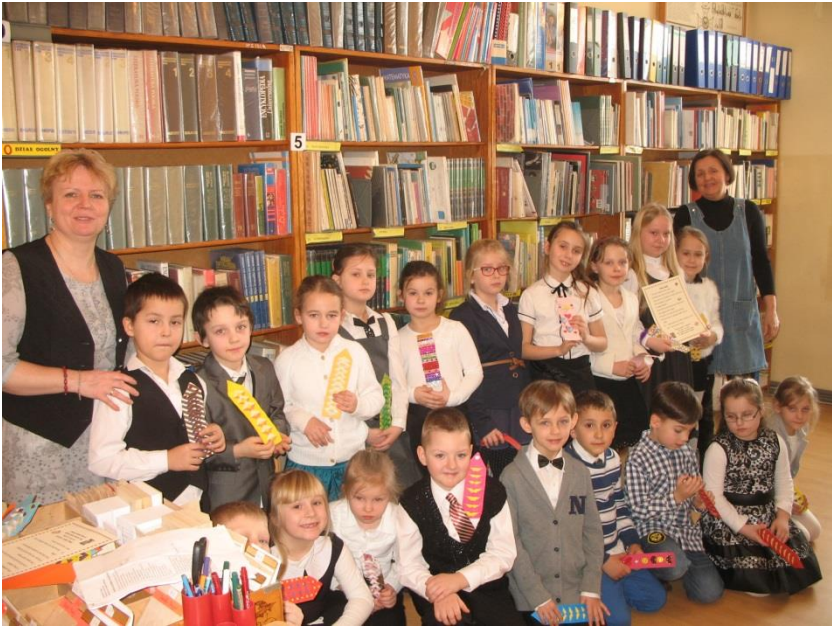
Pasowanie uczniów kl. I na czytelnika.