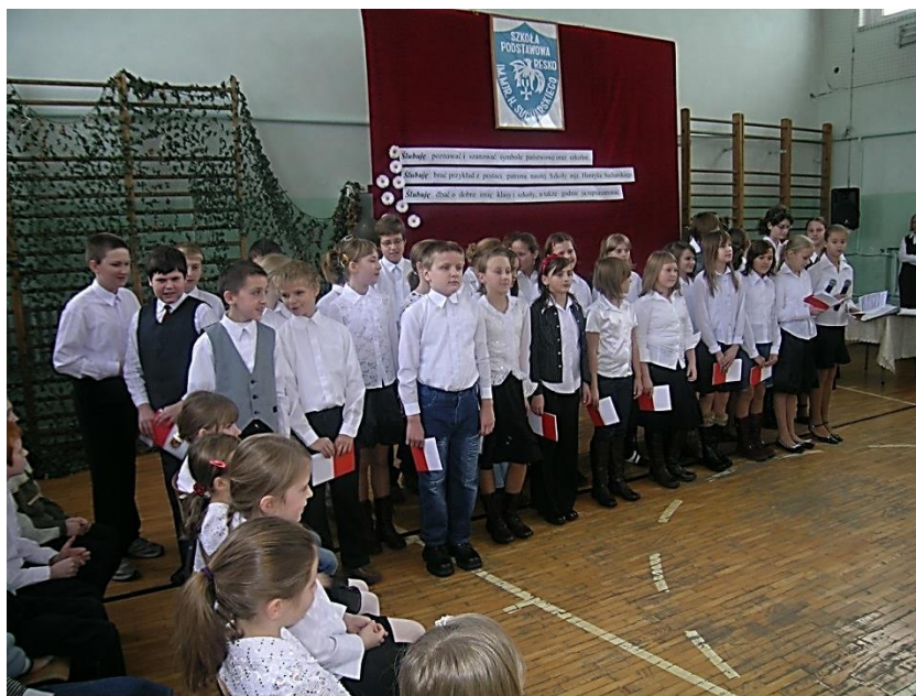
Święto Patrona – listopad 2007r.