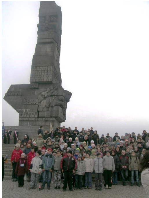
Pamiątkowe zdjęcie na Westerplatte uczestników wycieczki - Święto Patrona listopad 2008.