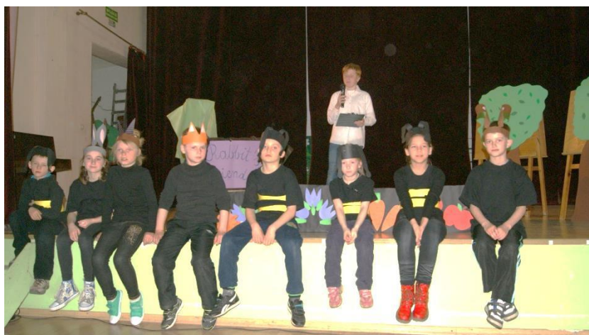
Łosońnica - udział w Przeglądzie Teatralnym 2015.