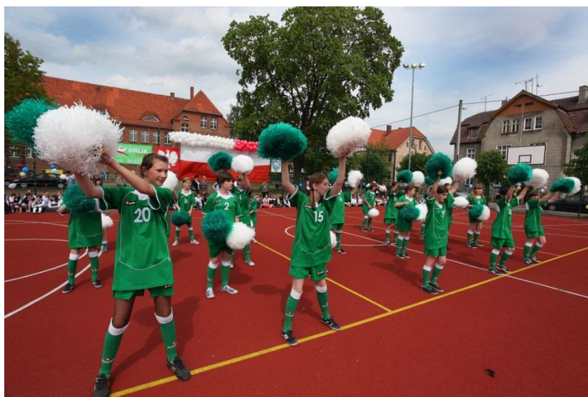
Uroczyste otwarcie Orlika 2012.

Jednym z największych wydarzeń było otwarcie Orlika 8 maja 2009r.