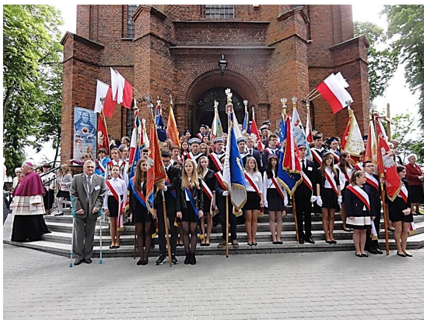
XXXII Sympozjum Tłuchowo 2015.