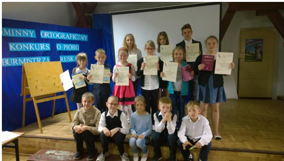
Gminny Konkurs Ortograficzny o Pióro Burmistrza Reska.