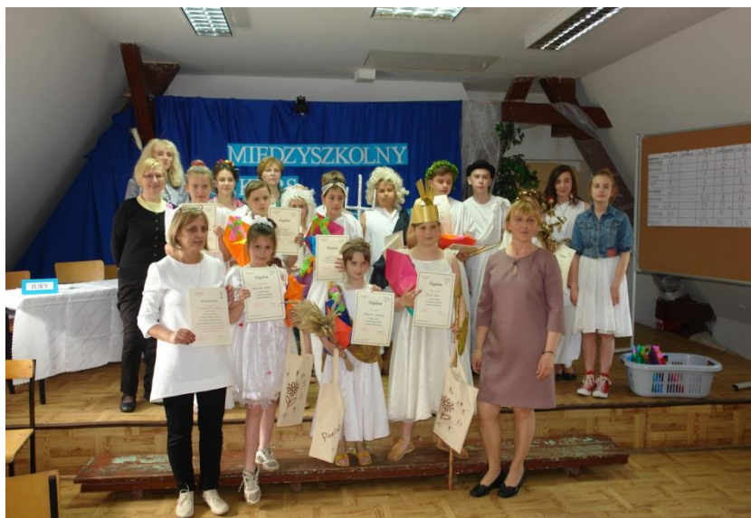
Międzyszkolny Konkurs Mitologiczny.