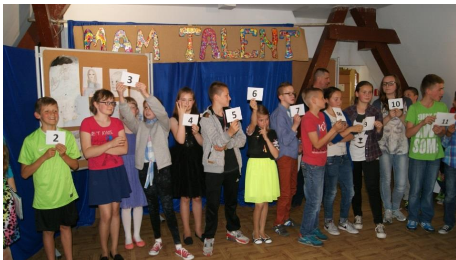
„Mam talent” w kategorii kl. IV–VI.