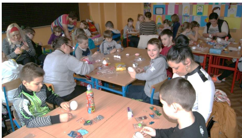
Idą święta - ozdabiamy wielkanocne jajka.