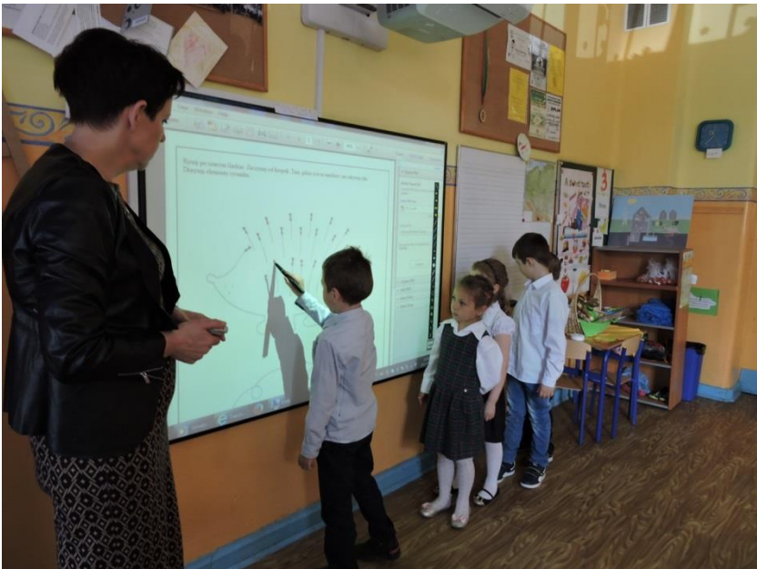
Tablica interaktywna w sali nr 2.

Z przekazanych pieniędzy zakupiono sprzęt multimedialny - projektor do tablicy interaktywnej. Obecnie, z wymienionych powyżej pomocy dydaktycznych, korzystają także inni uczniowie nauczania zintegrowanego, m. in. podczas dodatkowych zajęć z języka angielskiego (dyrekcja szkoły zapewniła oprogramowanie).