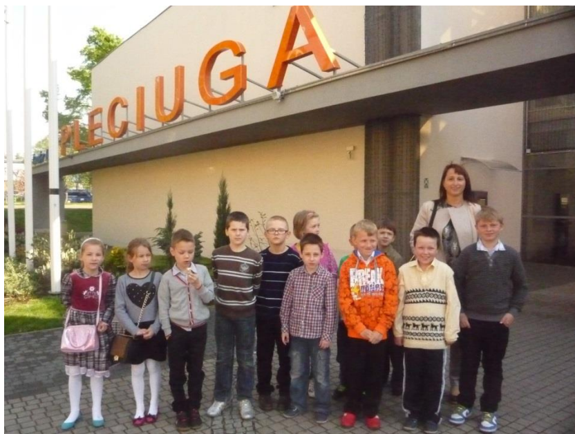
Wizyta w teatrze Pleciuga.