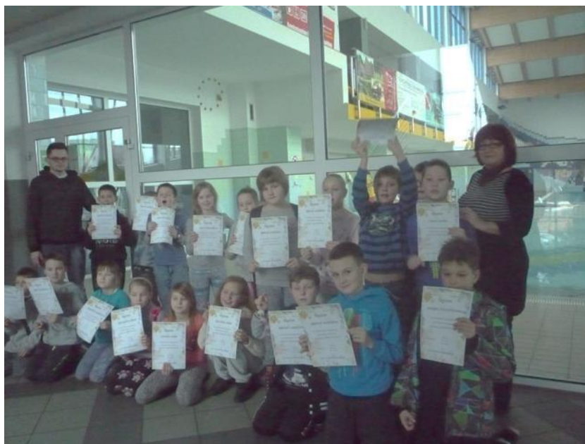
Zajęcia na basenie w Świdwinie.